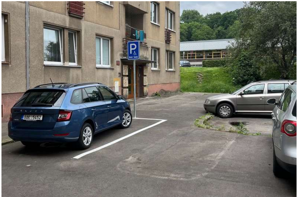
Obr. č. 81: místo vyhrazené pro oprávněnou osobu ZTP