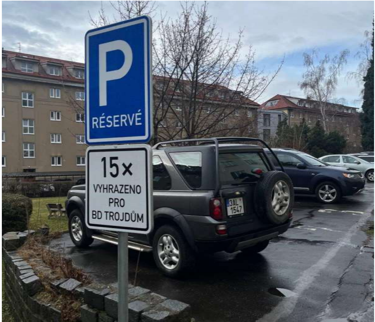
Obr. č. 35: privátní kolmé stání na zpevněné ploše