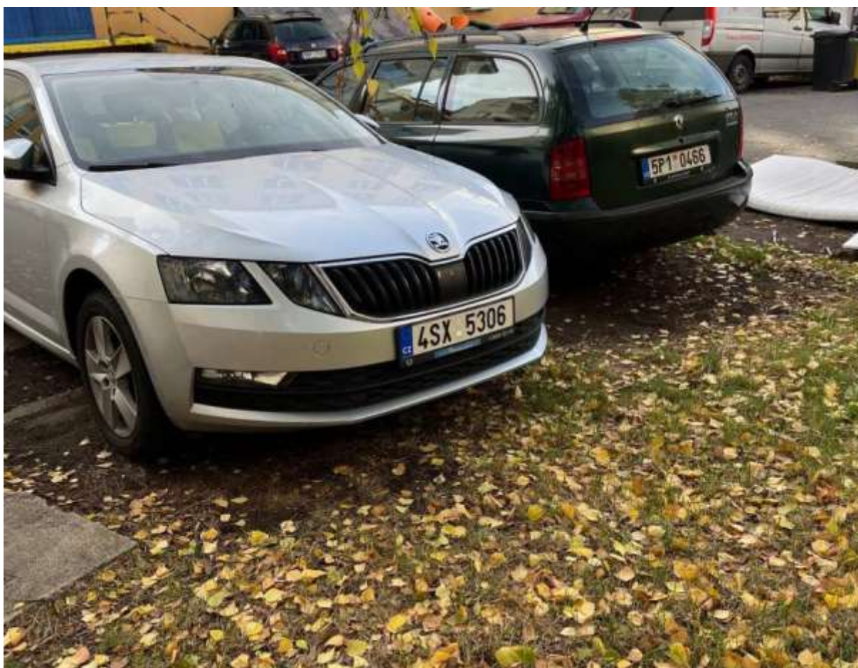
Obr. č. 23: Místo parkovacího stání na zeleni