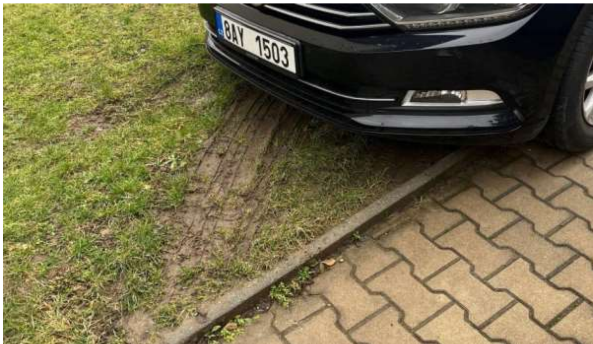
Obr. č. 69: vliv podélného parkování na zeleni