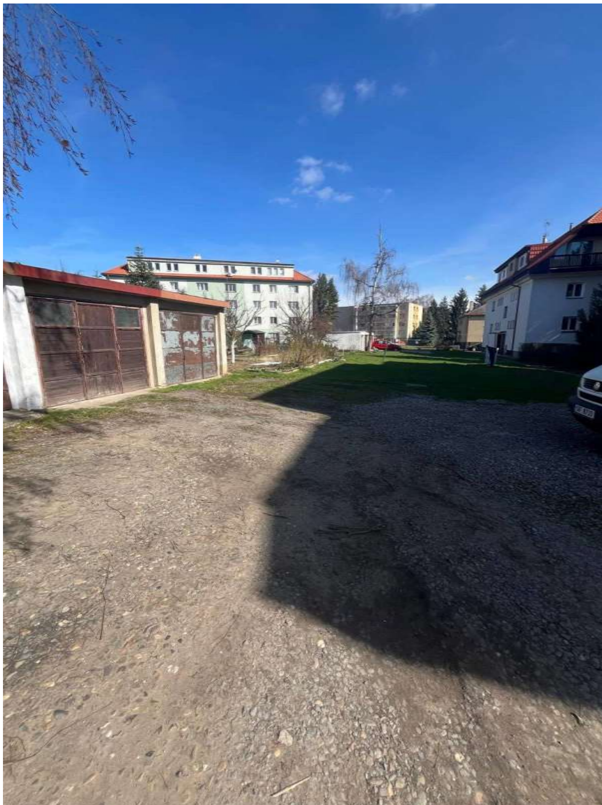
Obr. č. 75: situace ve vnitrobloku Mladčína