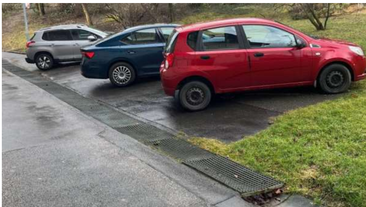
Obr. č. 59: parkovací stání na zpevněné ploše