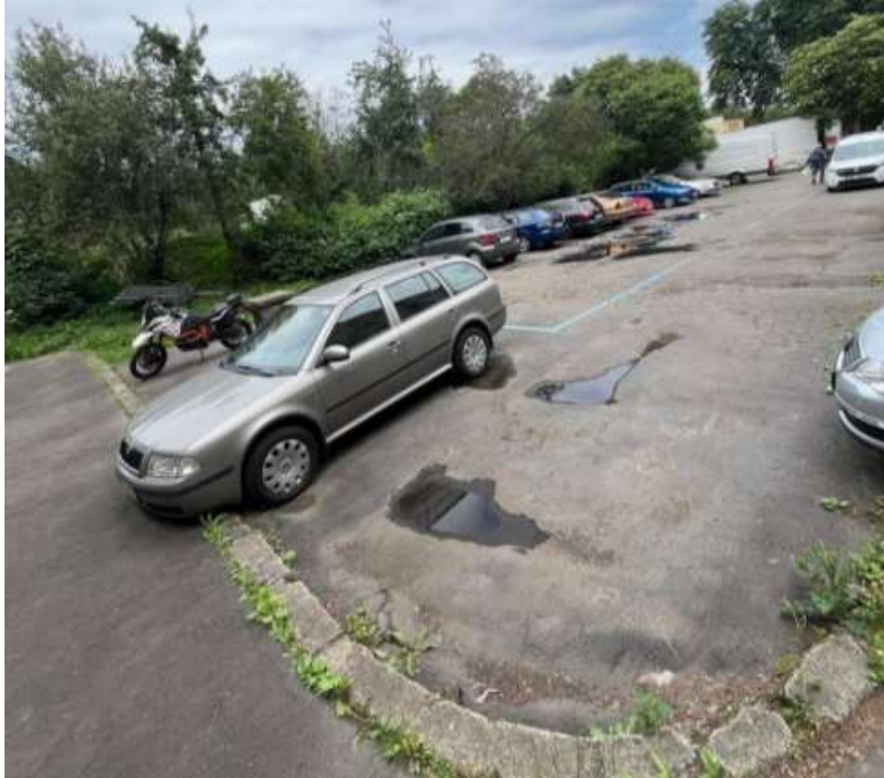
Obr. č. 80: situace ve vnitrobloku při ulicích Na Petynce x Patočkova