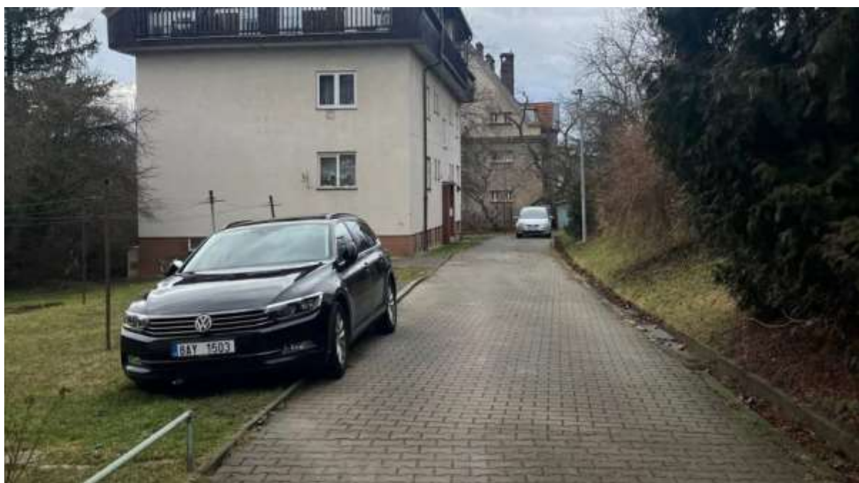
Obr. č. 68: parkovací situace ve spodní příjezdové komunikaci vnitrobloku