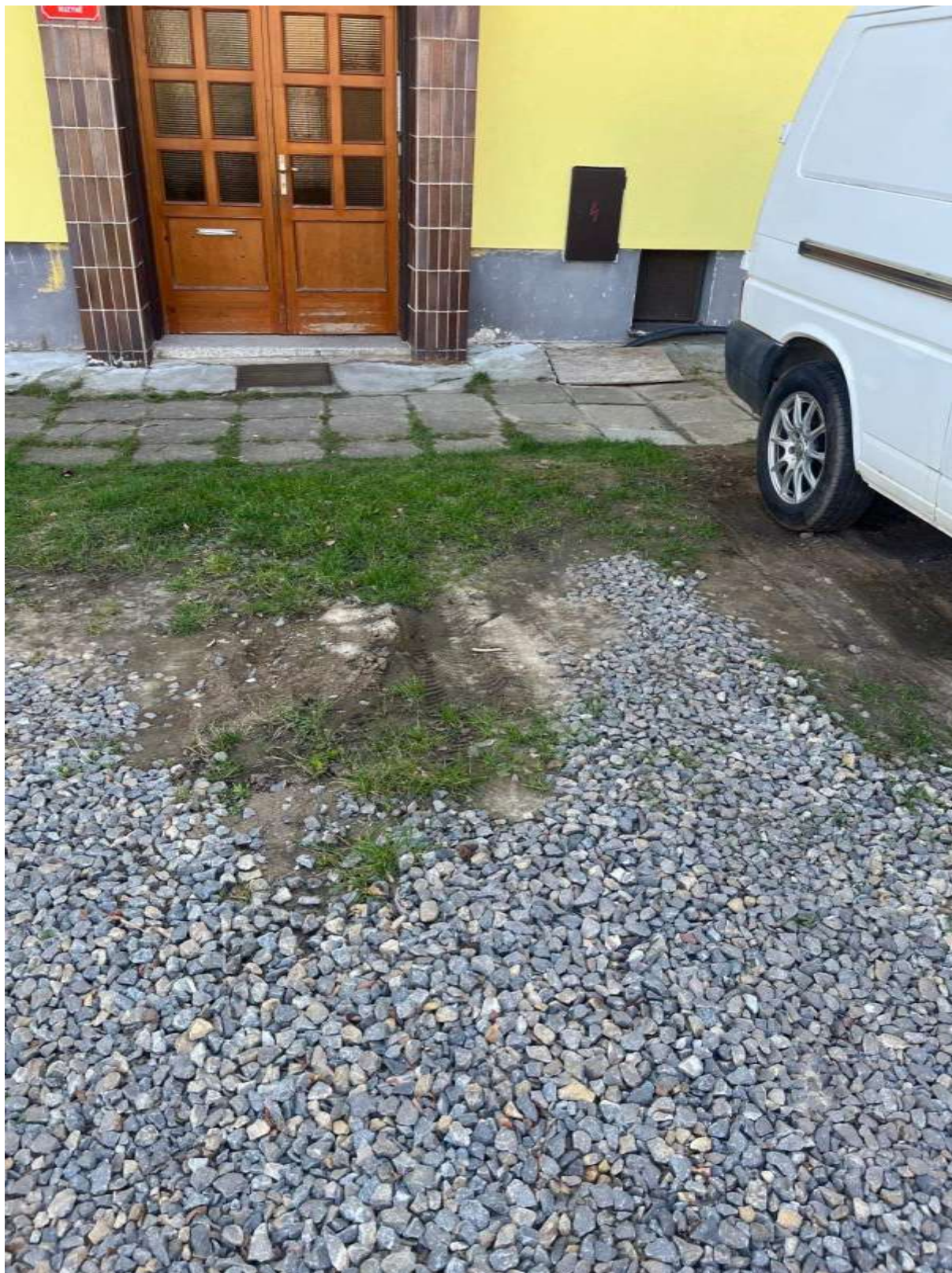
Obr. č. 73: travnatý porost zpevněný kamením