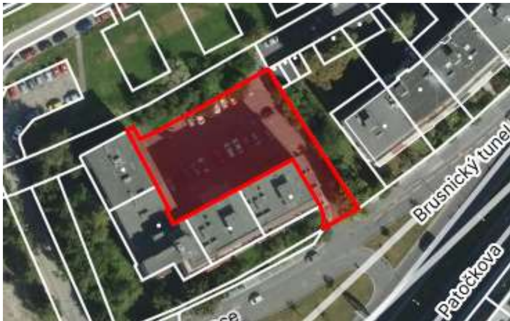
Obr. č. 77: vnitroblok při ulicích Na Petynce x Patočkova

Vnitroblok v ul. Na Petynce x Patočkova na parcele č. 571/2 , kat. území Střešovice je ve vlastnictví hl. m. Prahy se svěřenou správou městské části Praha 6.