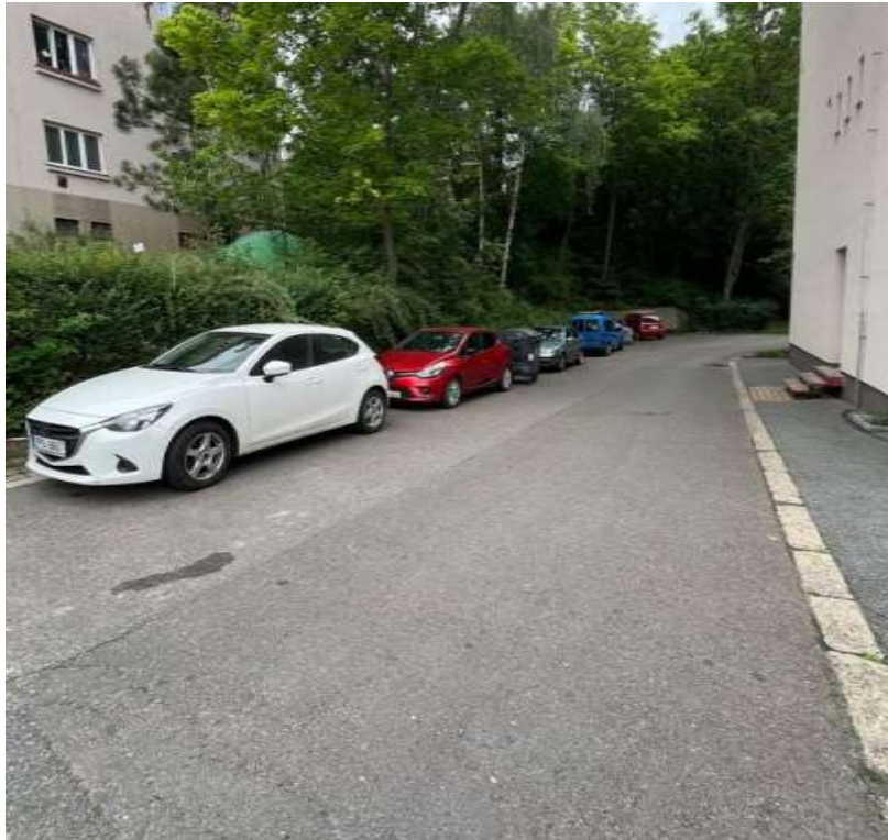
Obr. č. 92: automobily zaparkované mimo oficiálně vyznačená parkovací staní vnitrobloku č. 14 v ul. Na Petynce