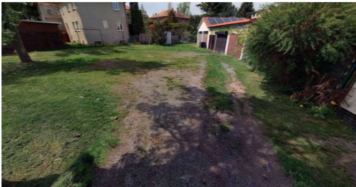
Obr. č. 39: místo, kde vlivem provozu automobilů ustoupil travnatý porost (fotografie z mapy.cz, období květen 2023, připojeno z důvodu lepší viditelnosti ústupu zeleně v období plné vegetace)