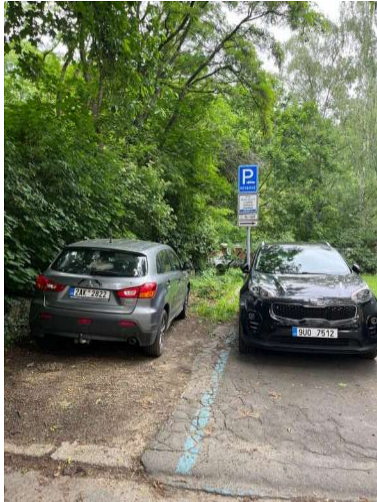
Obr. č. 89: parkování osobního automobilu mimo oficiálně vymezené parkovací stání, které způsobilo ústup travnaté plochy ve vnitrobloku č. 13 v ul. Na Petynce