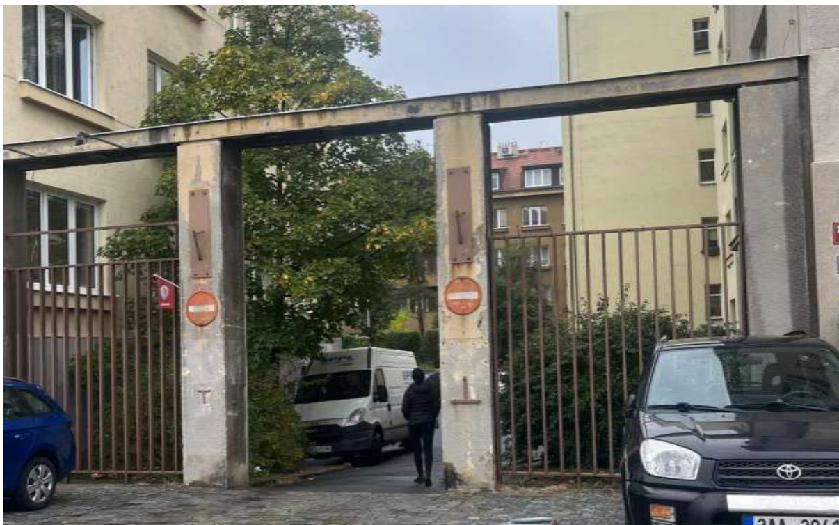
Obr. č. 3: Výjezd z vnitrobloku Velflíkova

Výjezd z vnitrobloku je označen dvěma dopravními značkami zákazu vjezdu. (Levá strana oplocené části vjezdu je součástí pozemku 607/1, pravá část vjezdu spadá pod pozemek č. 607/4, který je ve vlastnictví Společenství vlastníků Velflíkova 1427.)