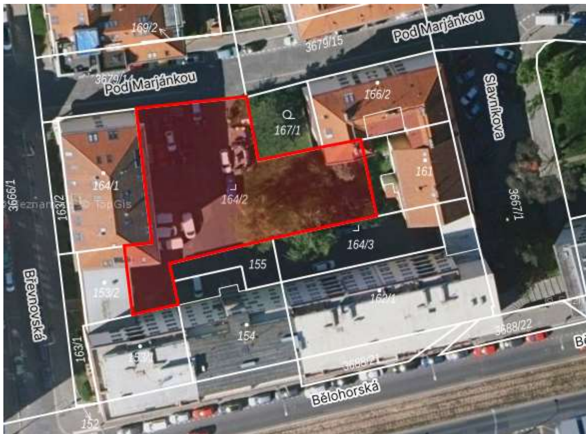
Obr. č. 18: Území vnitrobloku Pod Marjánkou, které je ve správě MČP6

Vnitroblok v ul. Pod Marjánkou na parcelách č. 164/2 , kat. území Břevnov je ve vlastnictví hl. m. Prahy se svěřenou správou městské části Praha 6.