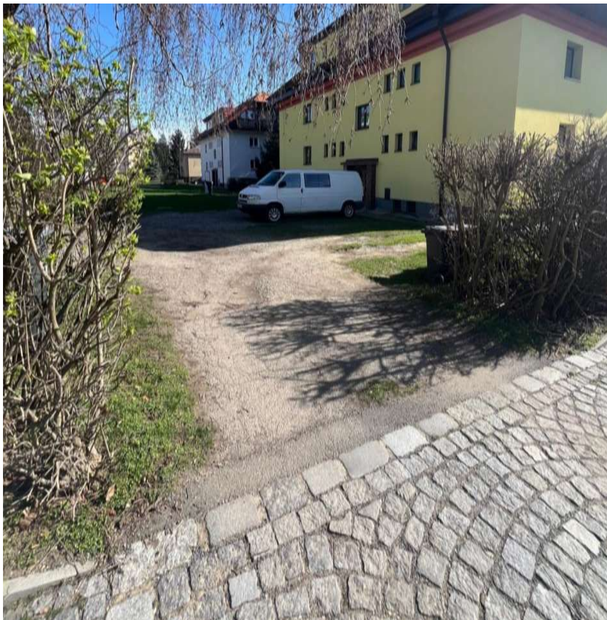
Obr. č. 72: vjezd do vnitrobloku Mladčina