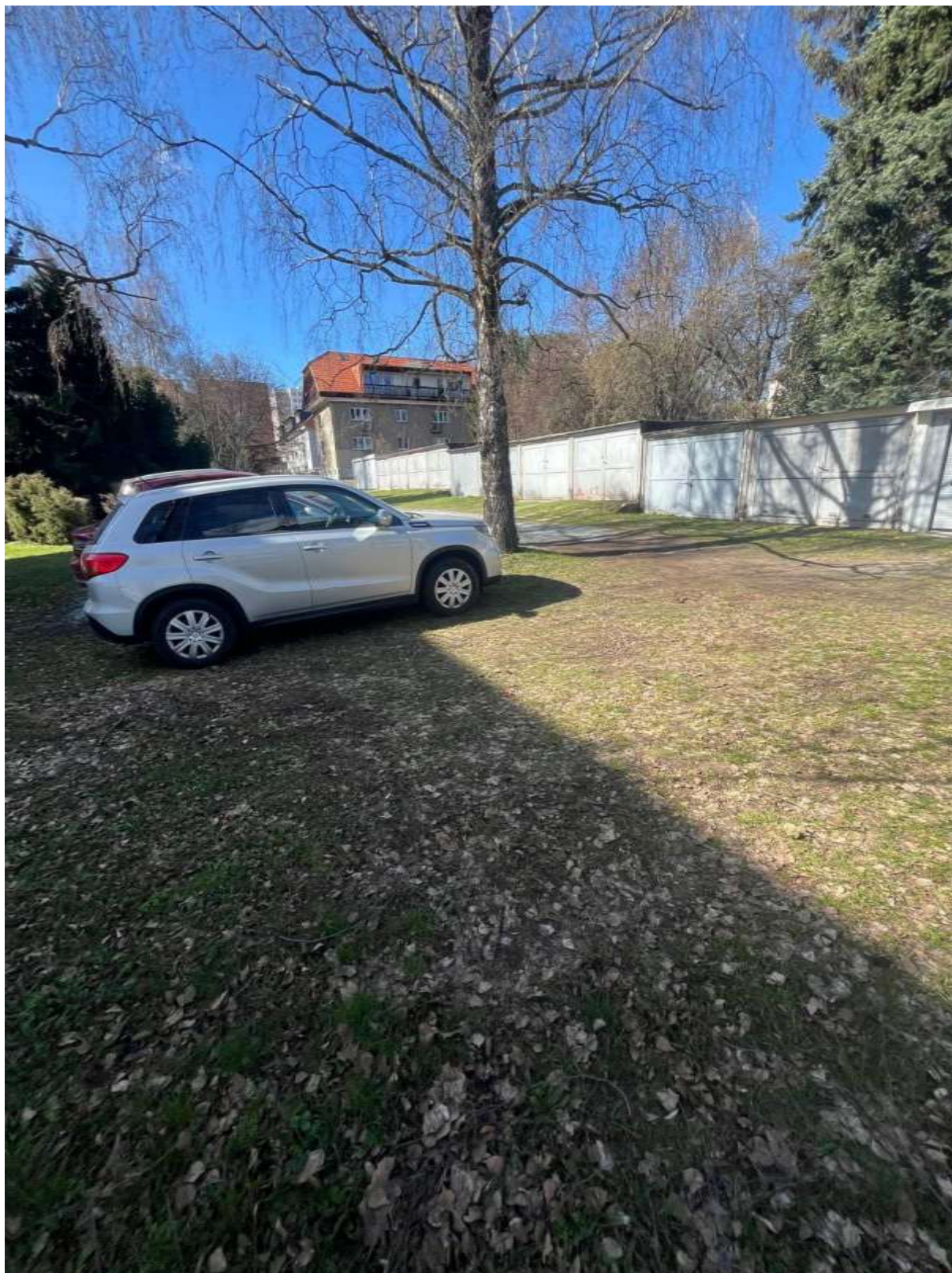
Obr. č. 52: situace ve vnitrobloku Vlastina