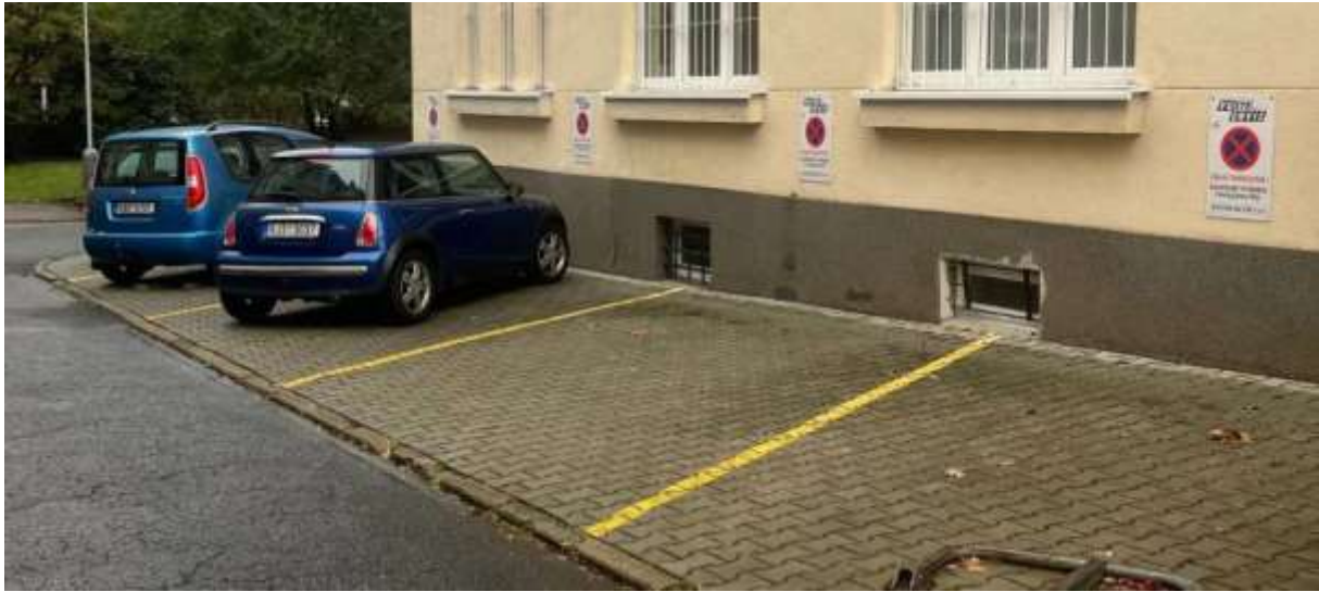
Obr. č. 4: Vyhrazená parkovací stání u budovy Velflíkova 1431/10 ve vnitrobloku