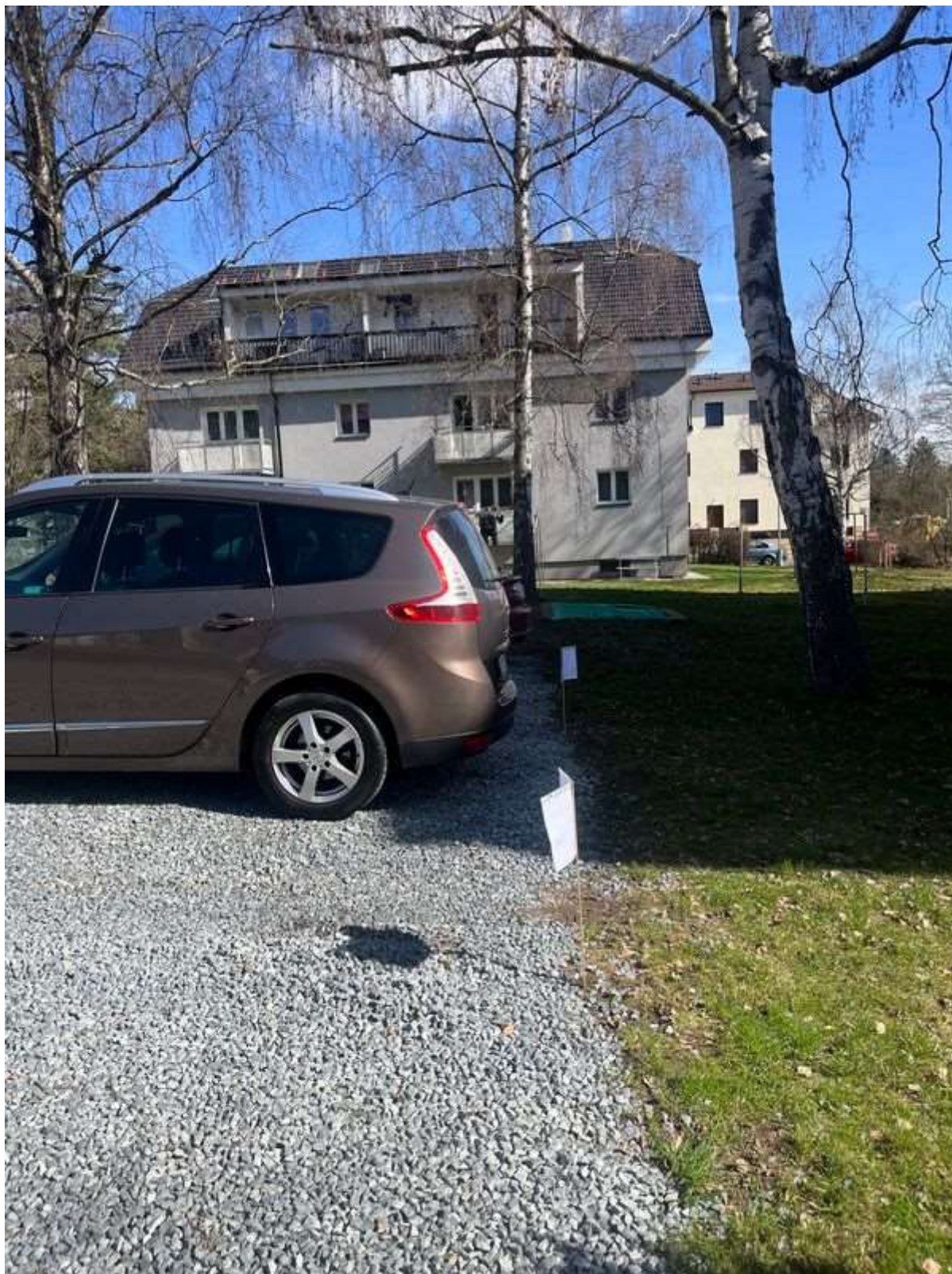
Obr. č. 53: parkování ve vnitrobloku Vlastina