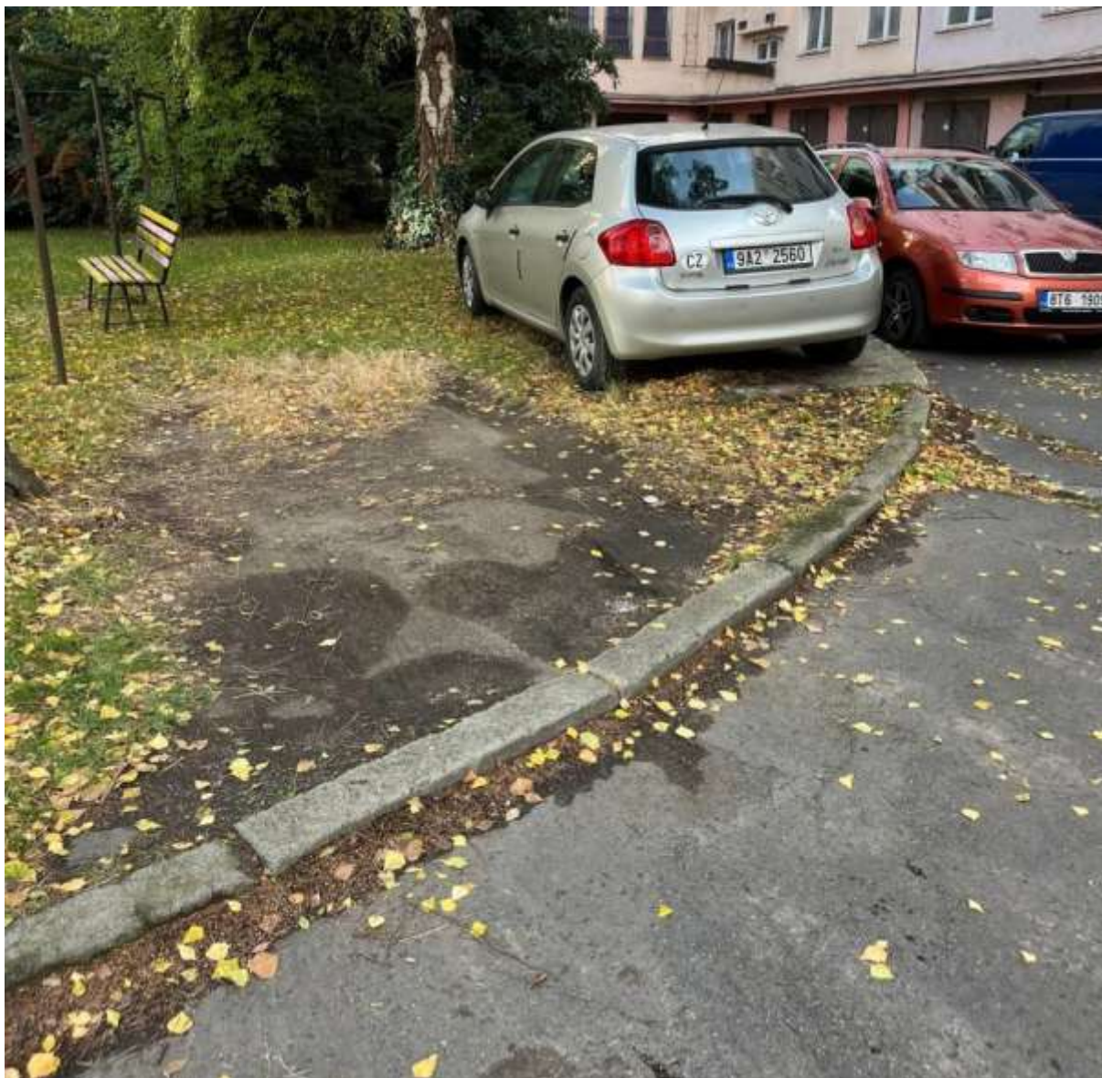
Obr. č. 21: Místo parkovacího stání na zeleni