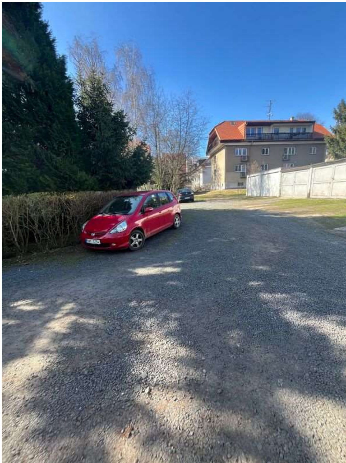
Obr. č. 54: situace ve vnitrobloku Vlastina