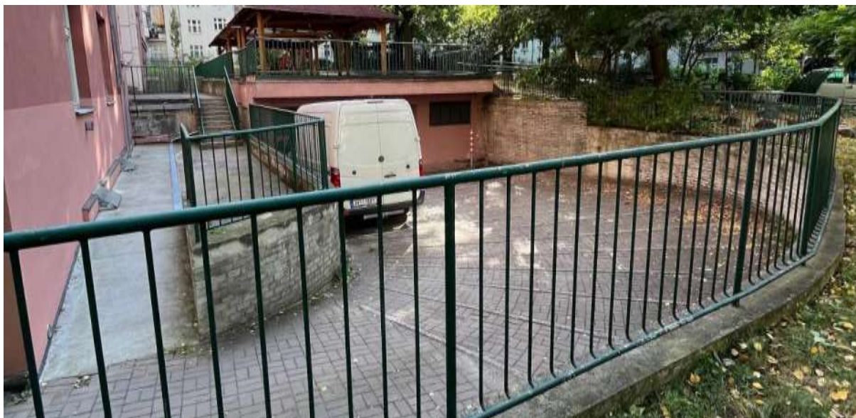
Obr. č. 27: Parkovací plocha a garáže ve vnitrobloku Studentská