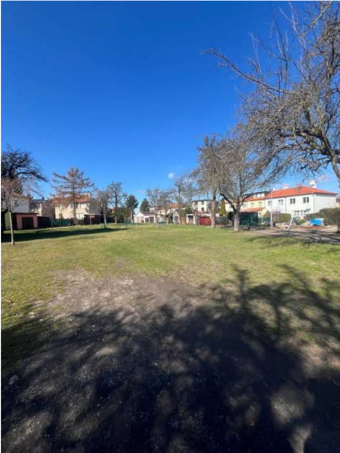
Obr. č. 42: situace ve vnitrobloku Parašutistů