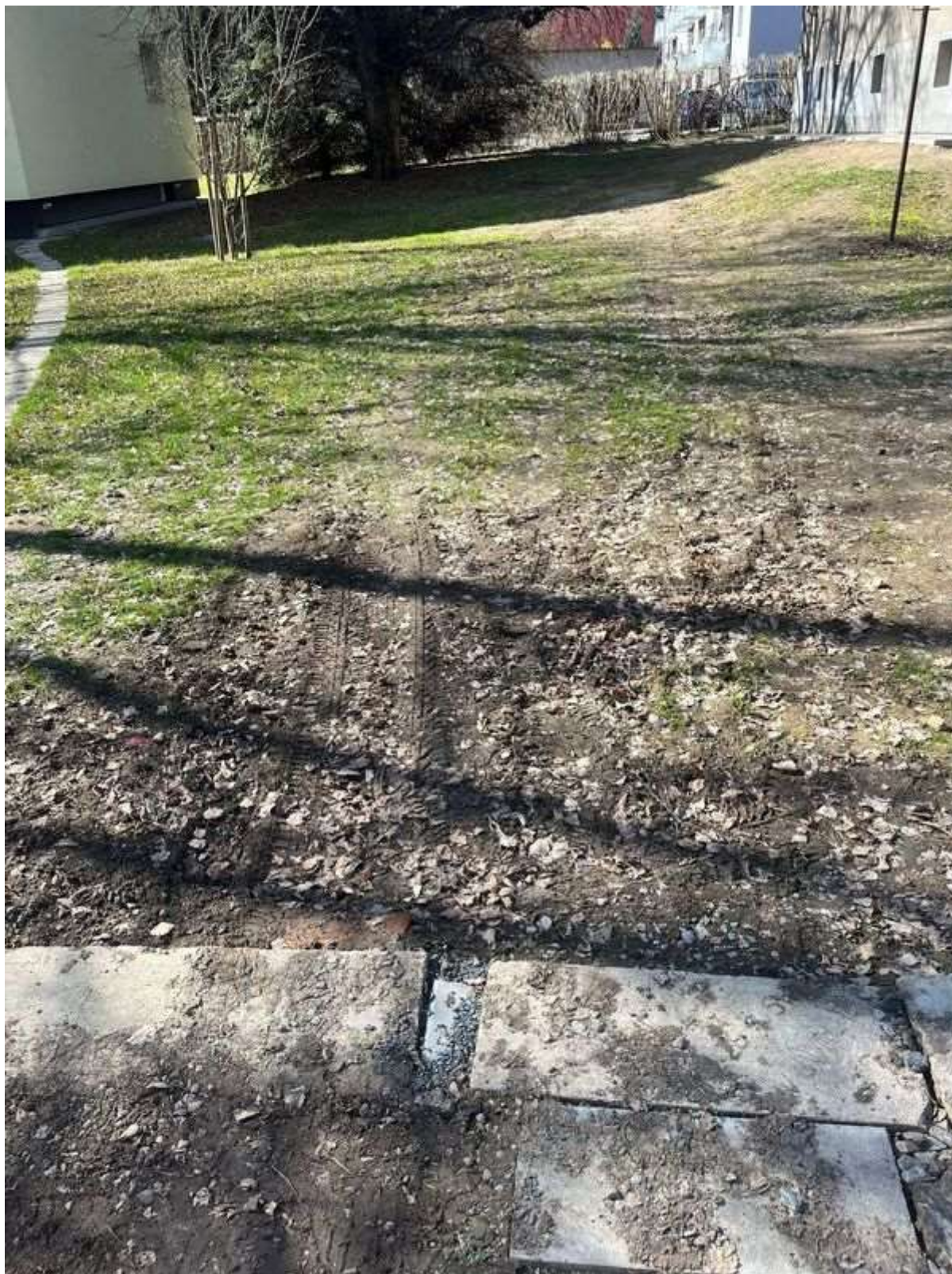
Obr. č. 56: travnatý porost poškozený vlivem parkování