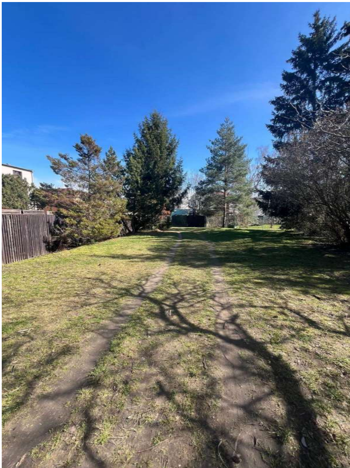
Obr. č. 45: Situace ve vnitrobloku Radistův (pohled směrem k příjezdové cestě)