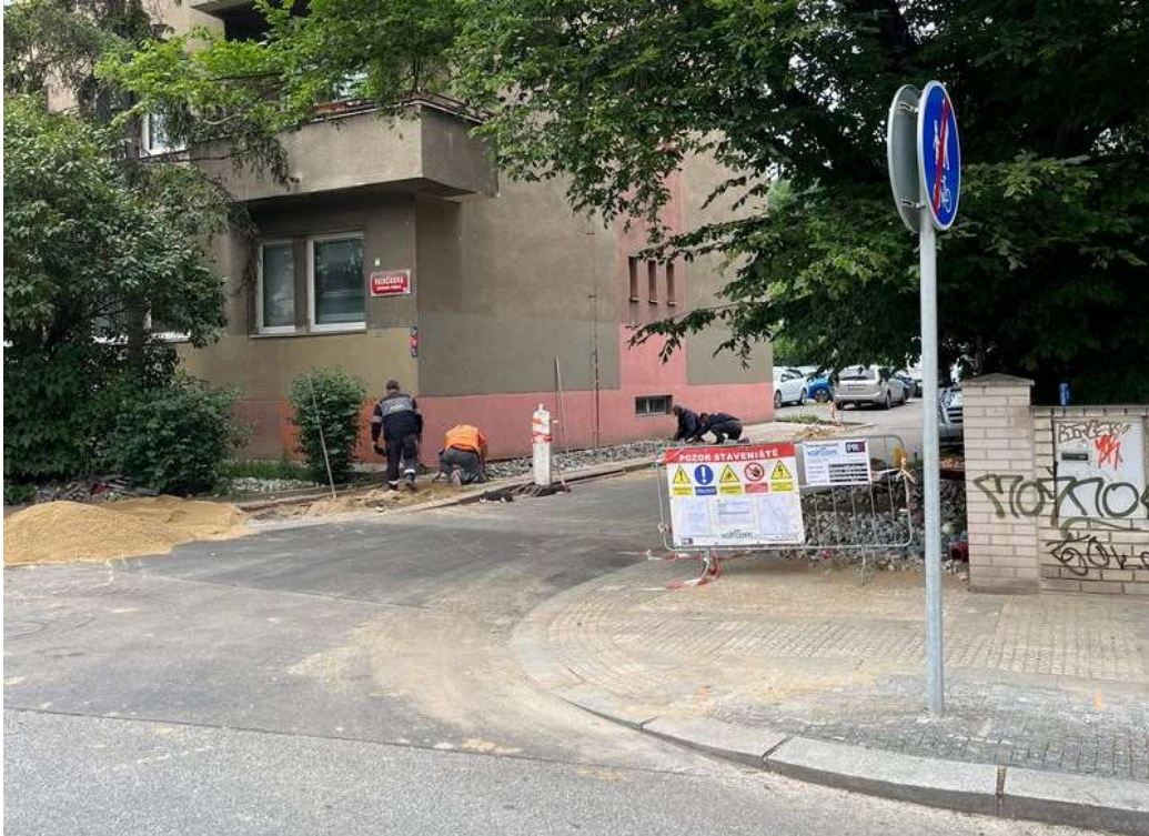
Obr. č. 78: vjezd do vnitrobloku při ulicích Na Petynce x Patočkova