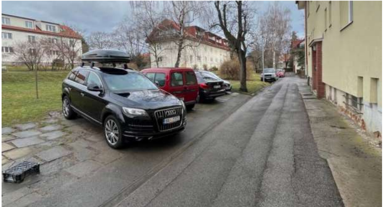
Obr. č. 60: parkovací stání na zpevněné ploše (i zde částečné narušení zeleně, viz další foto)