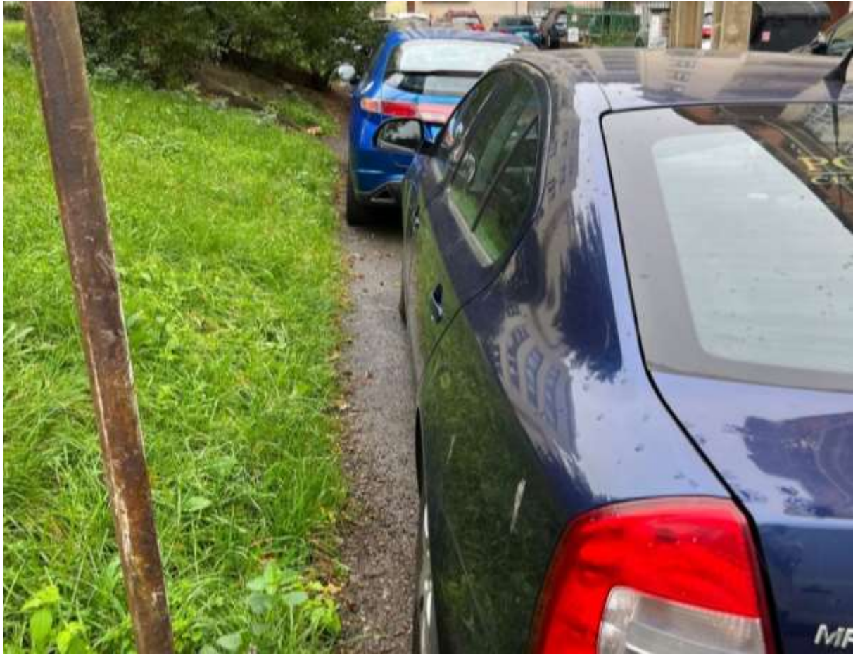
Obr. č. 9: Vyhrazené podélné parkovací stání ve vnitrobloku Velflíkova ve vztahu k zatravněné ploše