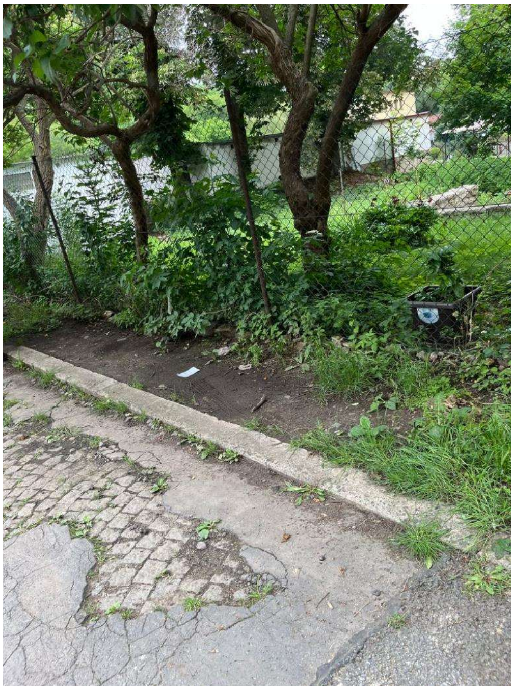
Obr. č. 83: narušení zeleně ve vnitrobloku při ulicích Na Petynce x Patočkova