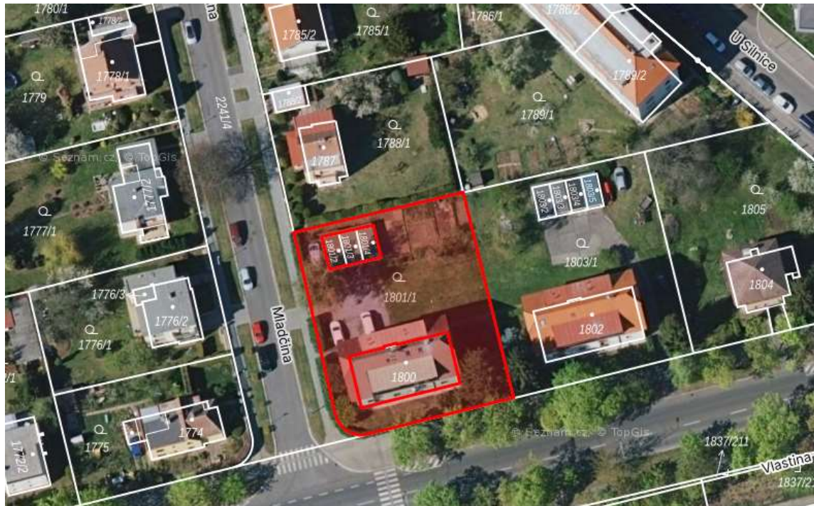
Obr. č. 71: Vnitroblok v ul. Mladčina

Vnitroblok v ul. Mladčina na parcele č. 1801/1 , kat. území Ruzyně je ve vlastnictví hl. m. Prahy se svěřenou správou městské části Praha 6.