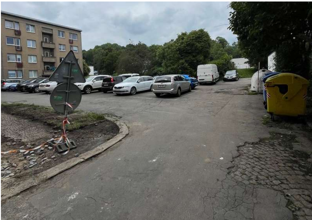
Obr. č. 79: situace ve vnitrobloku při ulicích Na Petynce x Patočkova