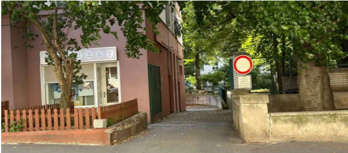
Obr. č. 25: Dopravní značení při vjezdu do vnitrobloku Studentská