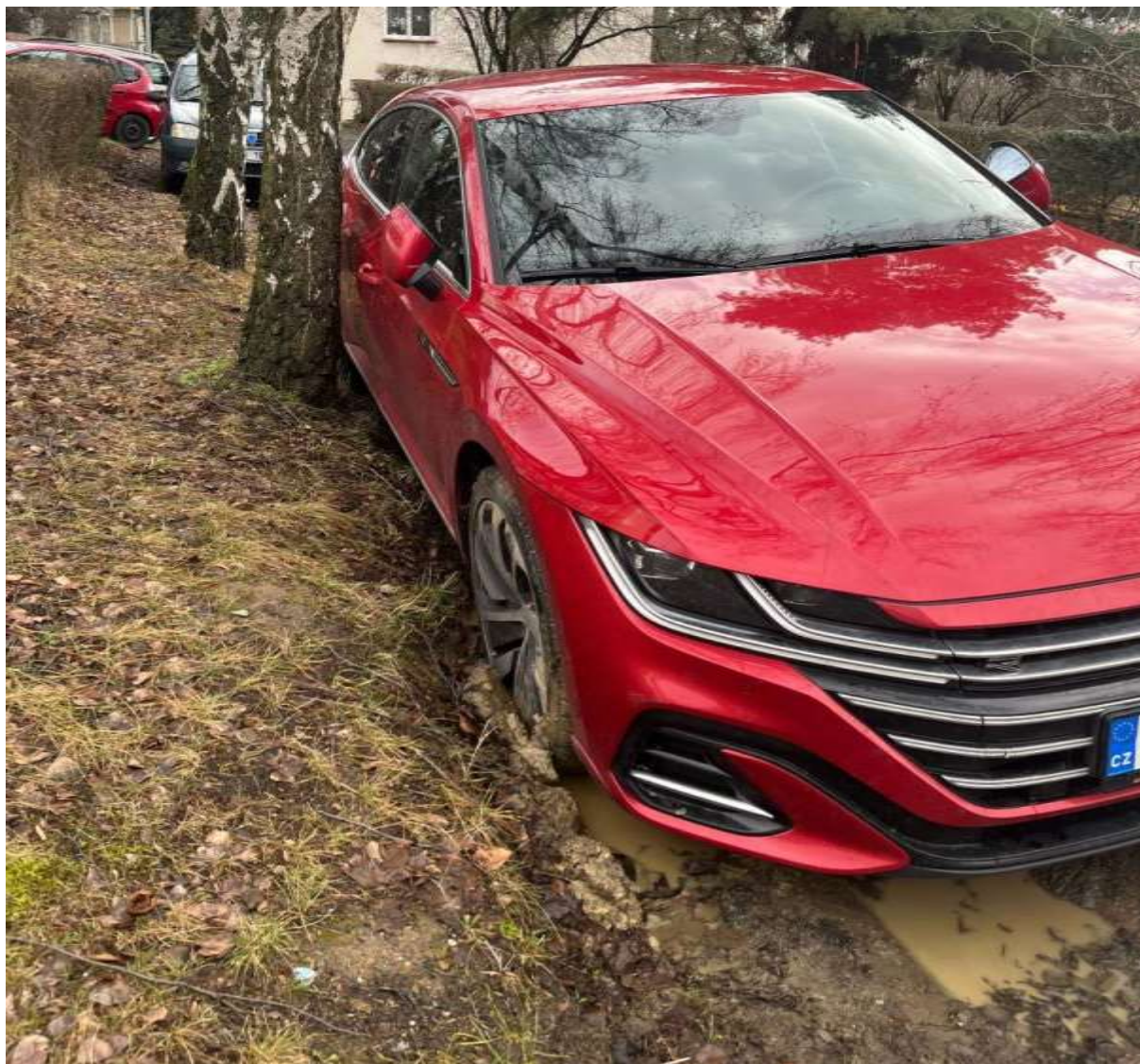
Obr. č. 63: v rámci neoficiálního parkovacího stání (viz předešlé foto) dochází i k ohrožení dřevin