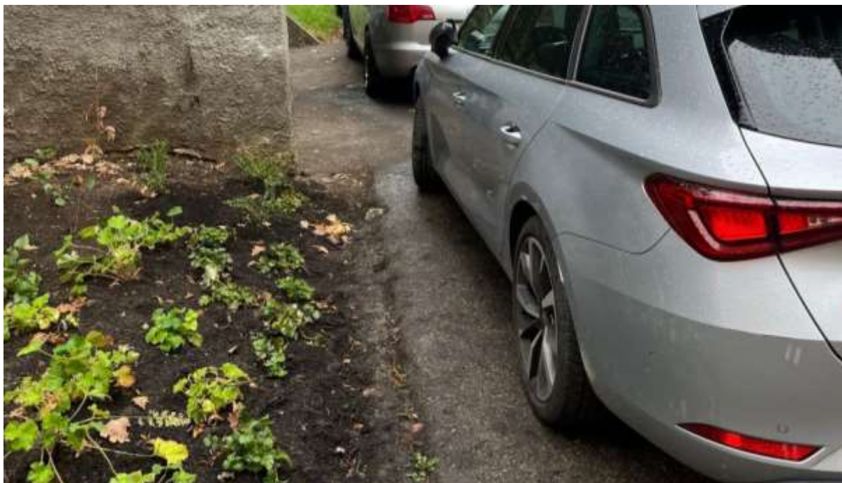
Obr. č. 7: Nevyhrazené podélné parkovací stání ve vnitrobloku Velflíkova ve vztahu k zatravněné ploše