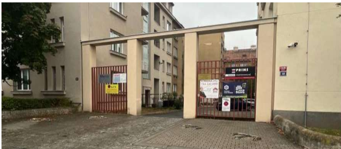
Obr. č. 2: Vjezd do vnitrobloku Velflíkova

U vjezdu do vnitrobloku, nejsou instalovány žádné dopravní značky. (Pouze na kovovém oplocení po obou stranách vjezdového oblouku jsou připevněny reklamní cedule. Na každé straně se pak také nachází jedna cedule zajišťující vyhrazené parkovací stání, která na sobě nese značku zákazů zastavení a informaci, že pozemky před těmito cedulemi jsou soukromé. Po levé straně vjezdu, na pozemku parc. č. 607/3 je parkování vyhrazeno bytovému družstvu a na pravé straně, na pozemku par. č. 607/2 je parkování vyhrazeno společnosti VUSTE ENVIS, s r.o.)