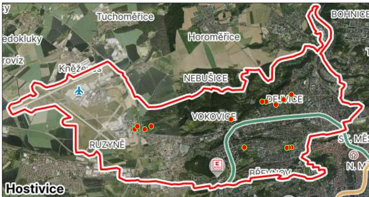
Obr. č. 1: Grafické znázornění lokalit řešených vnitrobloků

Z důvodu zjištění skutečné situace na území vnitrobloků na území Prahy 6 proběhlo v období října 2023 a února až dubna 2024 mapování místní situace u konkrétních vnitrobloků, jejichž lokalita je znázorněna červenými body v mapě níže.