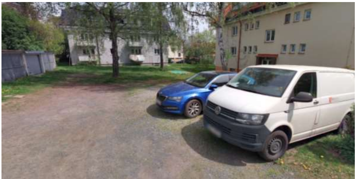
Obr. č. 50: místo, kde vlivem provozování automobilů ustoupil travnatý porost (fotografie z mapy.cz, období květen 2023, připojeno z důvodu lepší viditelnosti ústupu zeleně v období plné vegetace)