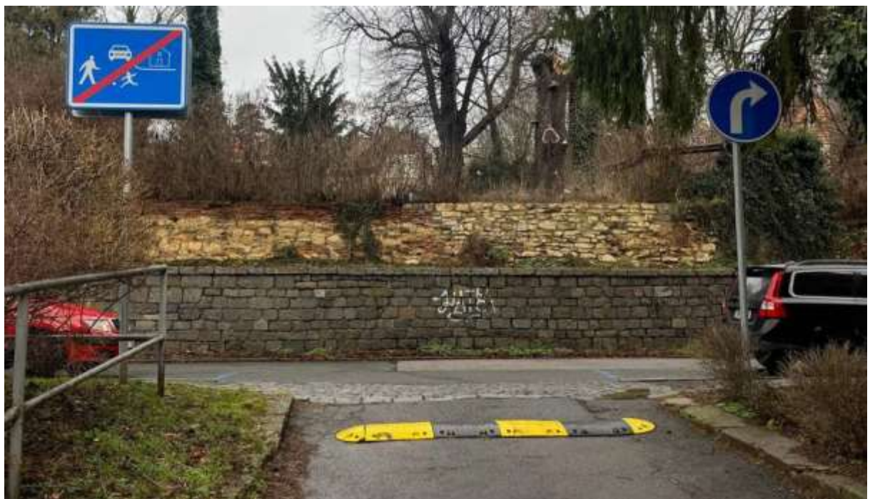
Obr. č. 36: dopravní značení při výjezdu směrem do ulice Na Vlčovce