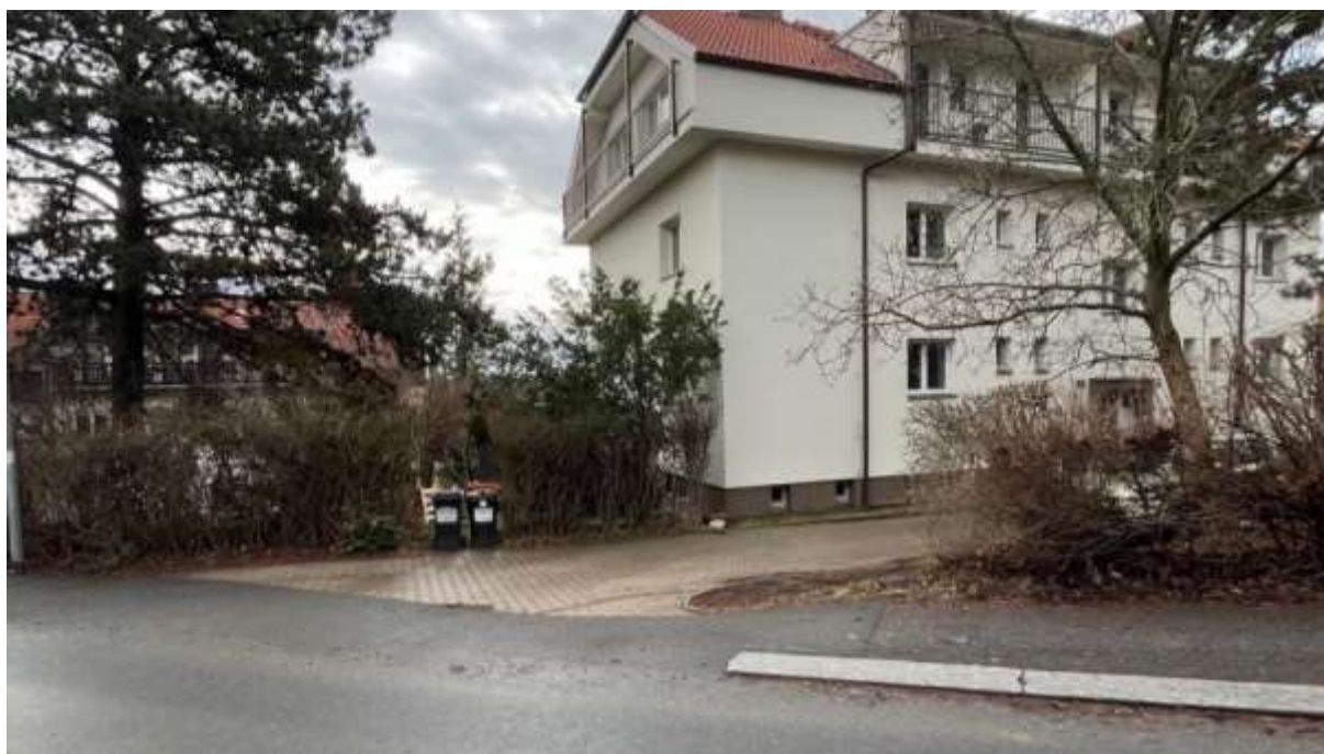
Obr. č. 65: Vrchní příjezd do vnitrobloku v ul. Na Bartoňce

Dva vjezdy, které jsou situovány z ulice „Na Bartoňce“ zde nejsou doprovázeny žádnou dopravní značkou. Zaparkovat se zde dá jen podélně při krajích komunikace. V některých místech je půda zpevněna betonovými zatravňovacími tvárnicemi. Jinde ale zaparkovaná auta stojí přímo na travnaté ploše.