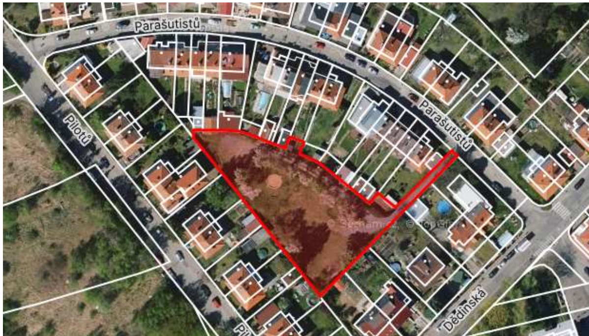
Obr. č. 37: Vnitroblok v ul. Parašutistů

Vnitroblok v ul. Parašutistů na parcele č. 1604/1 , kat. území Ruzyně je ve vlastnictví hl. m. Prahy se svěřenou správou městské části Praha 6.