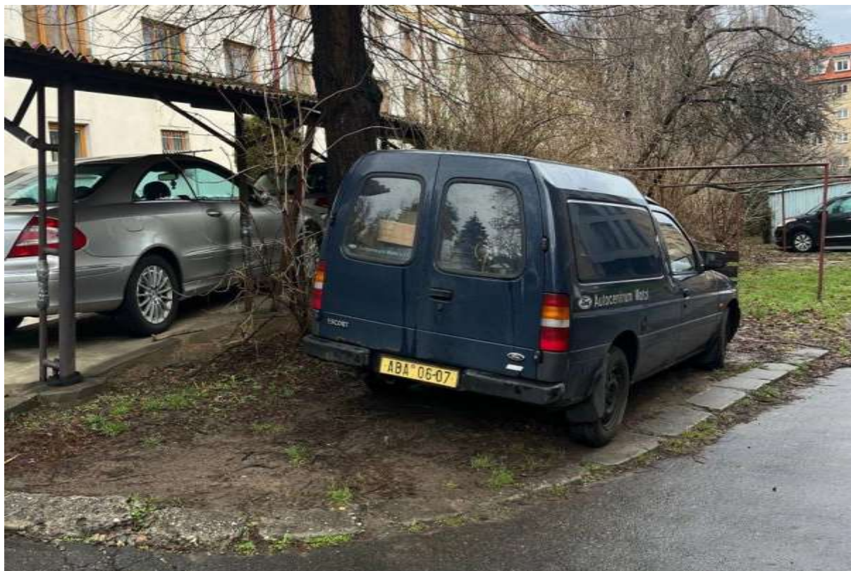
Obr. č. 33: automobil zaparkovaný mimo vyhrazené prkovací stání - ohrožení dřevin a travnatého porostu