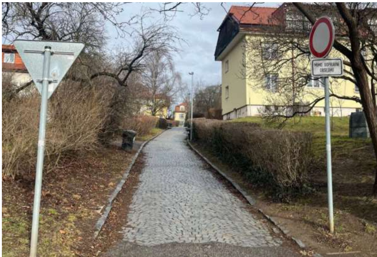
Obr. č. 58: dopravní značení u vjezdu č. 4