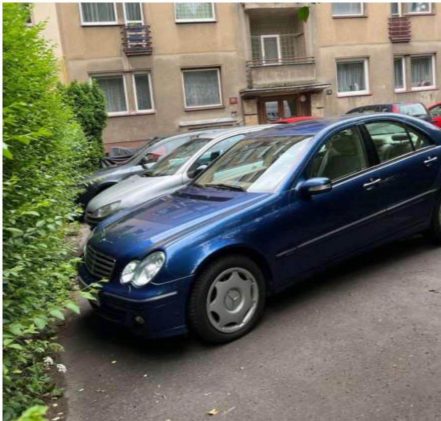
Obr. č. 87: situace ve vnitrobloku č. 13 v ul. Na Petynce