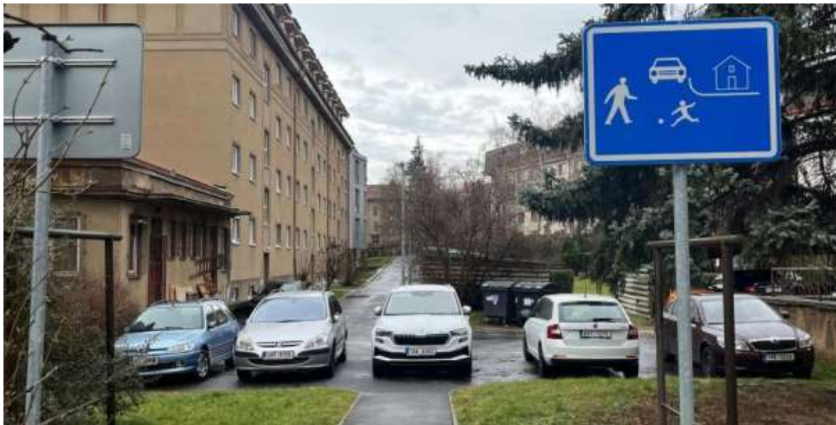
Obr. č. 31: kolmé parkování ve vnitrobloku šárecká