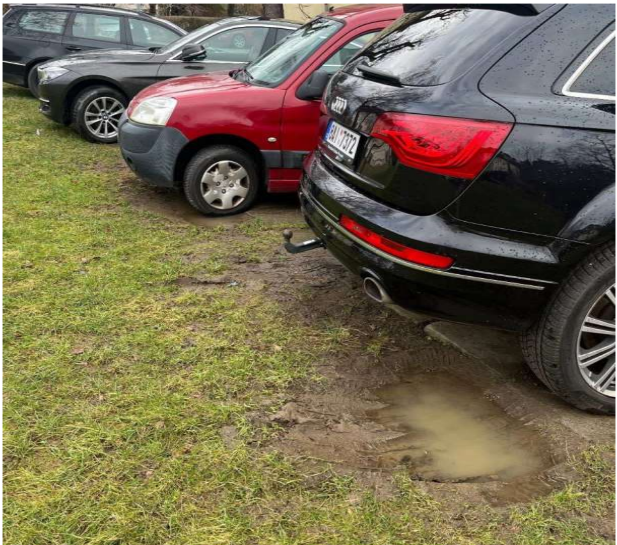
Obr. č. 61: narušování travnatého porostu u zpevněné plochy určené k parkování