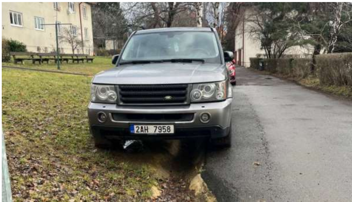
Obr. č. 62: podélné parkování, kdy automobily značně narušují travnatý porost