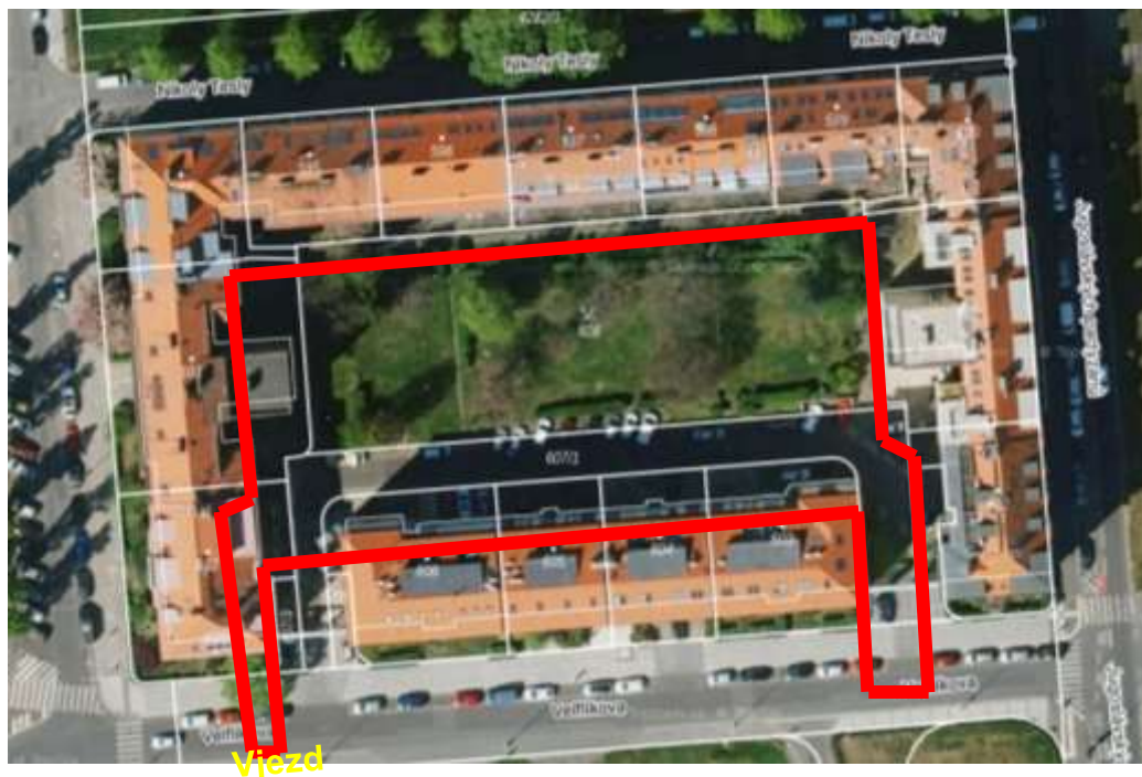
Obr. č. 1: Území vnitrobloku Velflíkova, které je ve správě MČP6

Vnitroblok v ul. Velflíkova na parcele č. 608 a 607/1 , kat. území Dejvice je ve vlastnictví hl. m. Prahy se svěřenou správou městské části Praha 6.