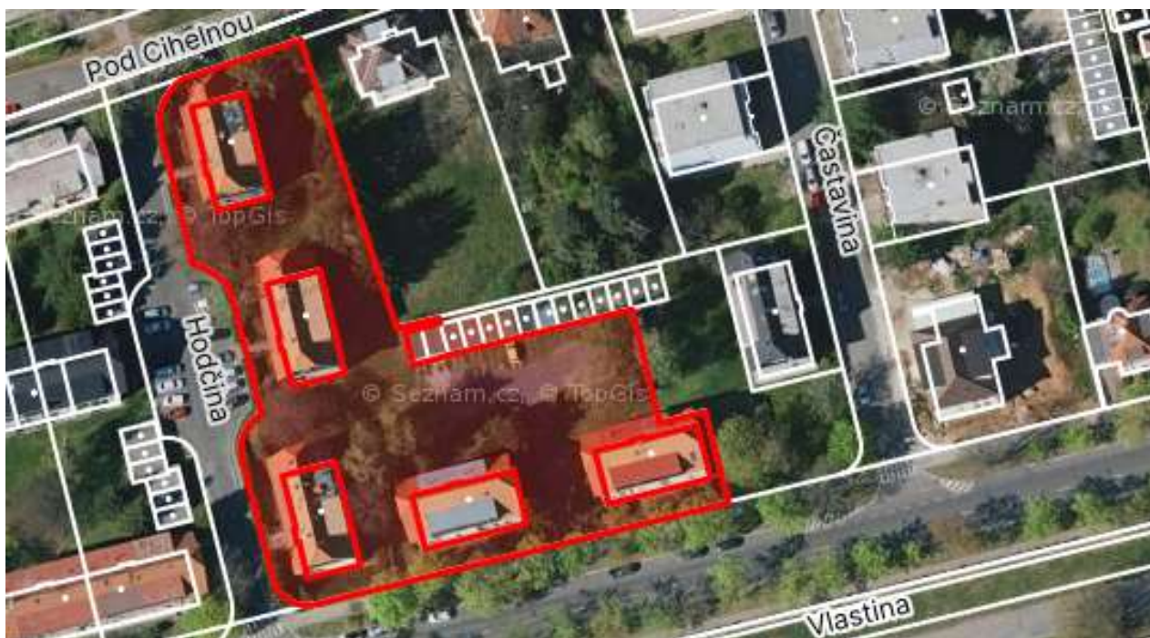
Obr. č. 48: Vnitroblok v ul. Vlastina

Příjezd, který vede z ulice Vlastina není opatřen žádnou dopravní značkou. Parkování je zde zajištěno především formou soukromých garáží. Parkovací místa na přilehlé ploše nejsou oficiálně vyznačena žádná. Automobily však využívají část zatravněné plochy, která byla zasypana šterkem a travní porost zde již zcela ustoupil.