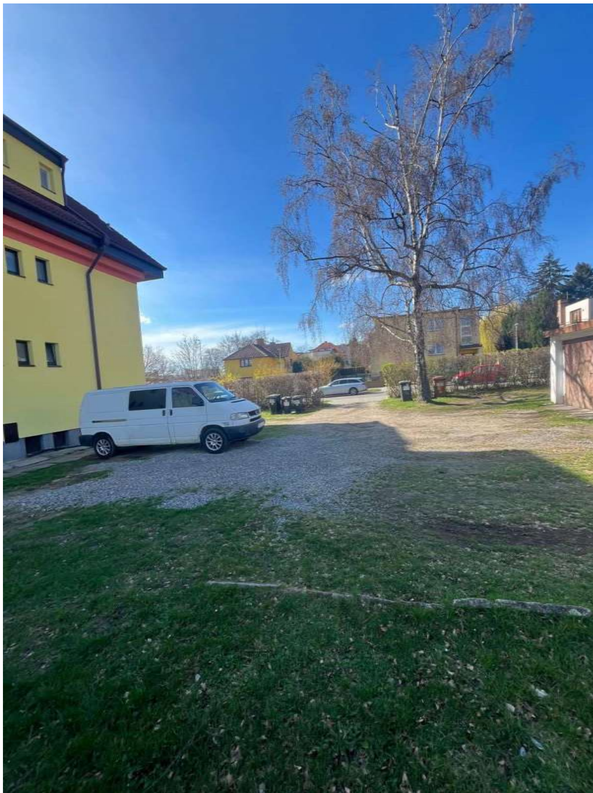
Obr. č. 76: situace ve vnitrobloku Mladčína