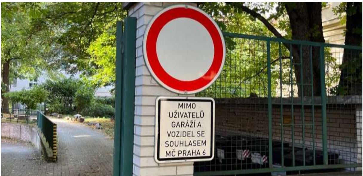
Obr. č. 26: Dopravní značení při vjezdu do vnitrobloku Studentská