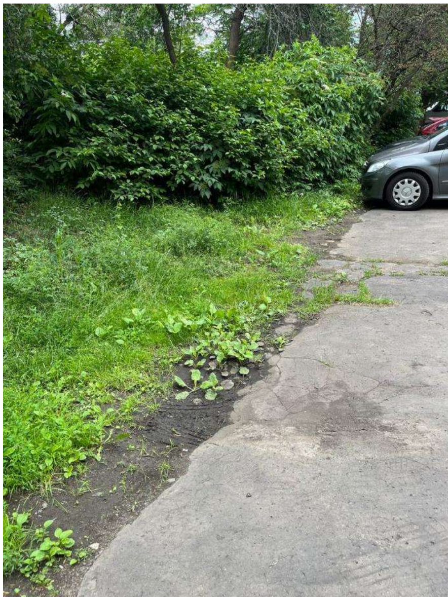
Obr. č. 82: narušení zeleně ve vnitrobloku při ulicích Na Petynce x Patočkova