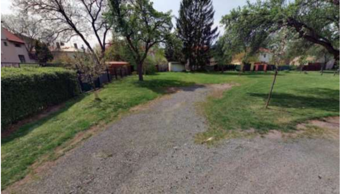
Obr. č. 40: místo, kde vlivem provozování automobilů ustoupil travnatý porost (fotografie z mapy.cz, období květen 2023, připojeno z důvodu lepší viditelnosti ústupu zeleně v období plné vegetace)