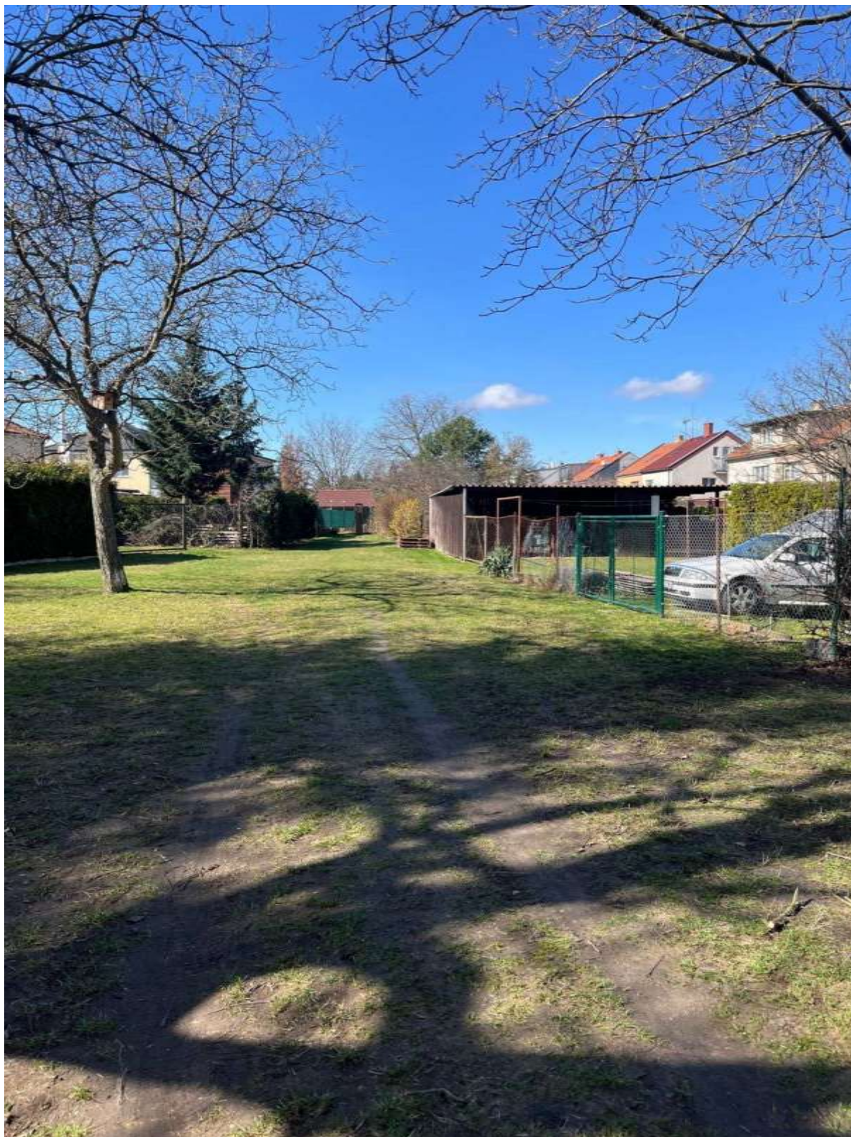
Obr. č. 46: Situace ve vnitrobloku Radistů