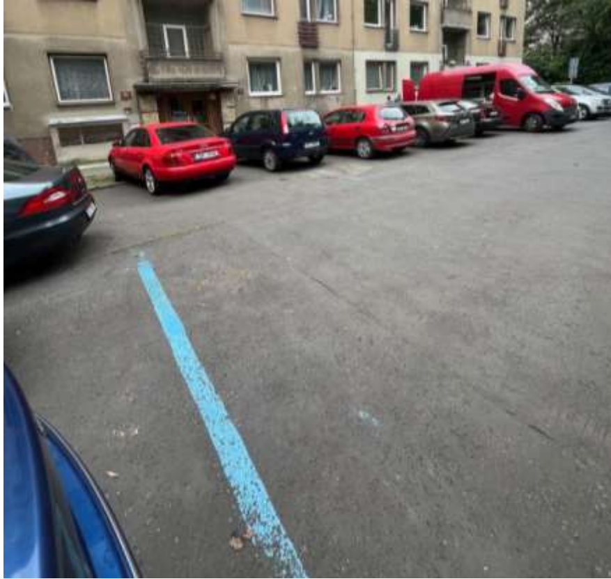
Obr. č. 86: situace ve vnitrobloku č. 13 v ul. Na Petynce