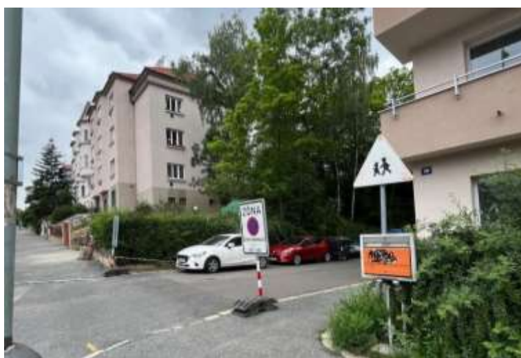
Obr. č. 91: vjezd/výjezd do vnitrobloku č. 14 v ul. Na Petynce

Při vjezdu do vnitrobloku je umístěna značka A12b „Děti“. Parkovací plochy jsou zde tvořeny zpevněnou plochou a vymezeny jsou pro rezidenty modrou zónou P6-1604. Při ohledání bylo zjištěno, že automobily jsou zde parkovány i mimo oficiálně vyznačená parkovací místa, ale k ohrožení zeleně zde nedochází.