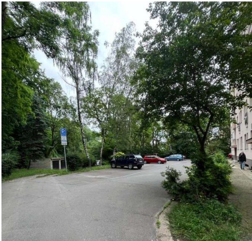
Obr. č. 92: situace ve vnitrobloku č. 14 v ul. Na Petynce