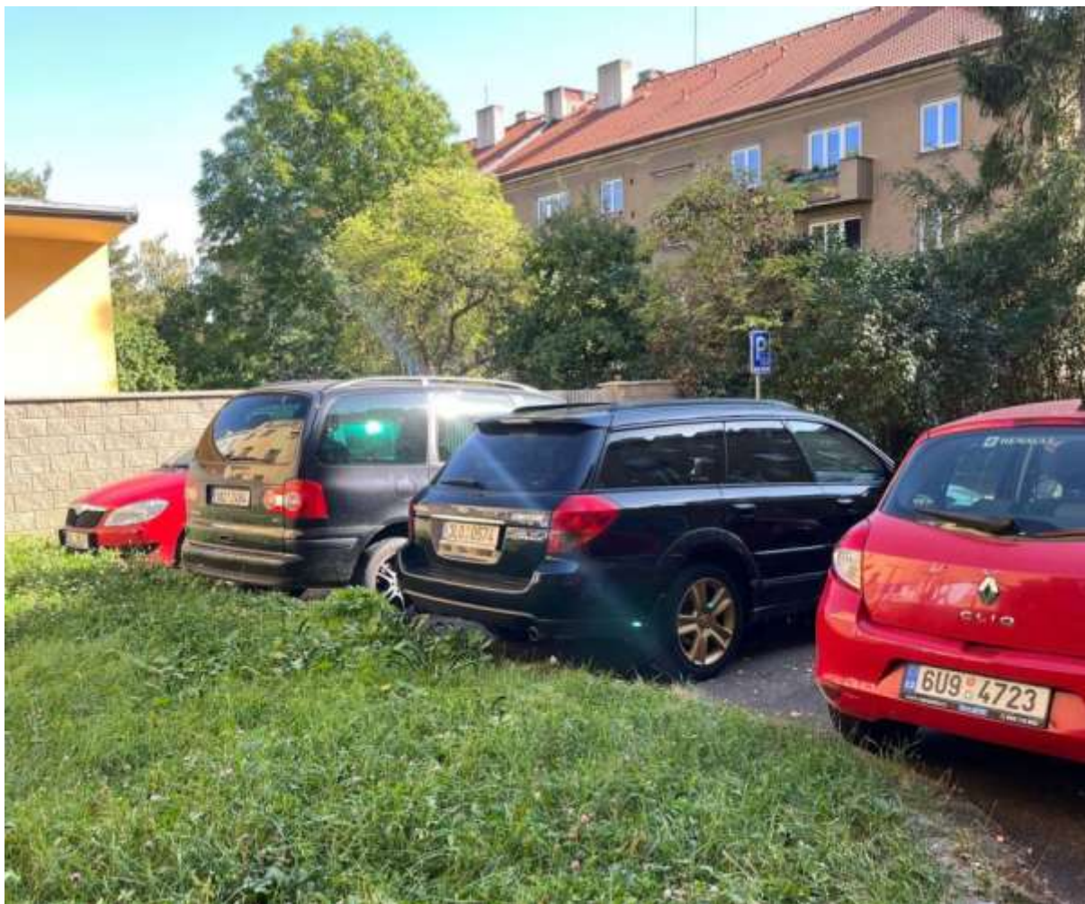
Obr. č. 17: Kolmá parkovací místa ve vnitrobloku Na Dlouhém lánu ve vztahu k zeleni