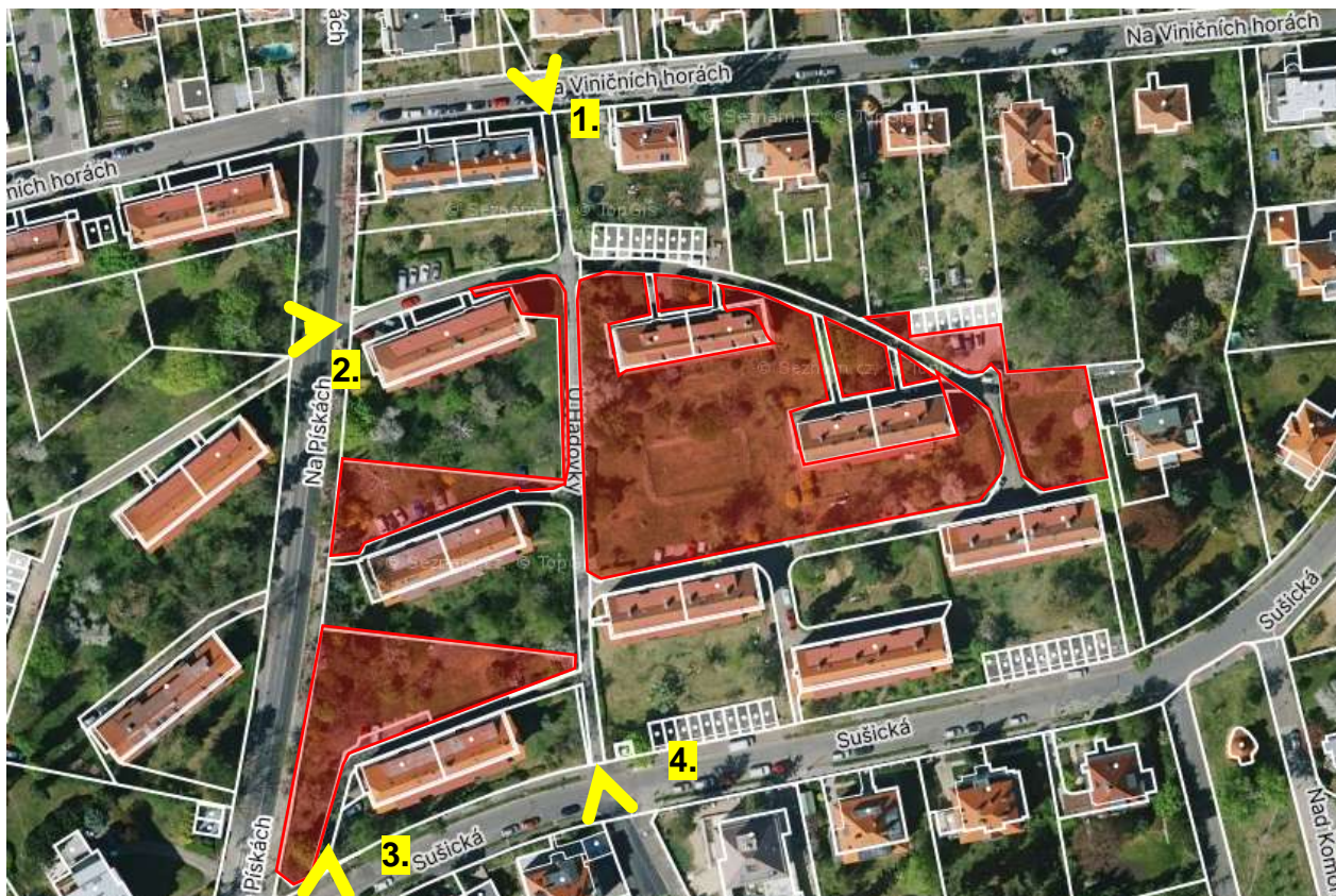
Obr. č. 57: Vnitroblok v ul. U Hadovky (žlutými šipkami označeny vjezdy/výjezdy)

Vnitroblok v ul. U Hadovky na parcelách č. 3852/1, 3852/15, 3852/16, 3852/17, 3852/6, 3846/9, 3845/4, 3845/6 , kat. území Dejvice je ve vlastnictví hl. m. Prahy se svěřenou správou městské části Praha 6.