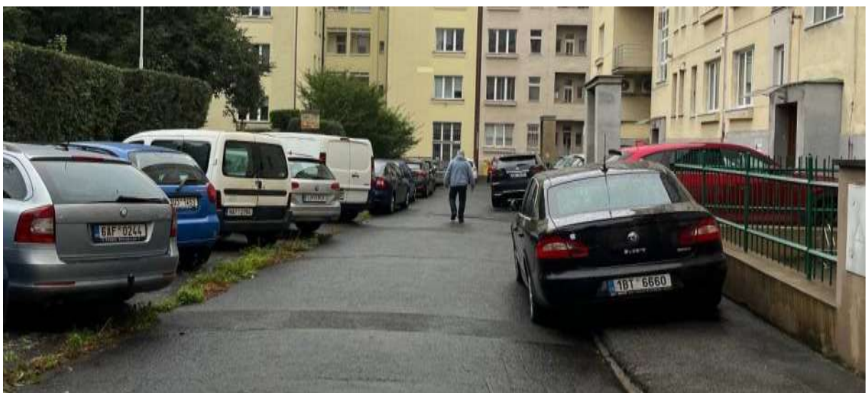
Obr. č. 6: Parkovací stání ve vnitrobloku Velflíkova