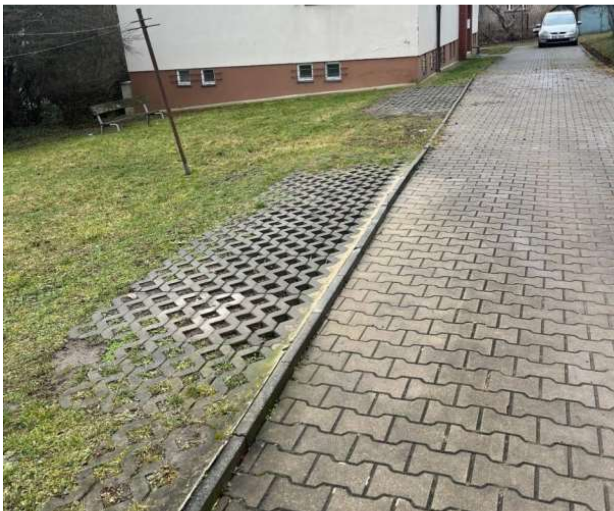
Obr. č. 70: zpevněná plocha