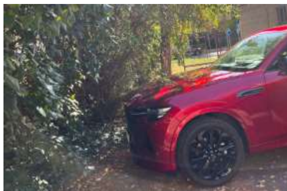
Obr. č. 16: Kolmá parkovací místa ve vnitrobloku Na Dlouhém lánu ve vztahu k zeleni