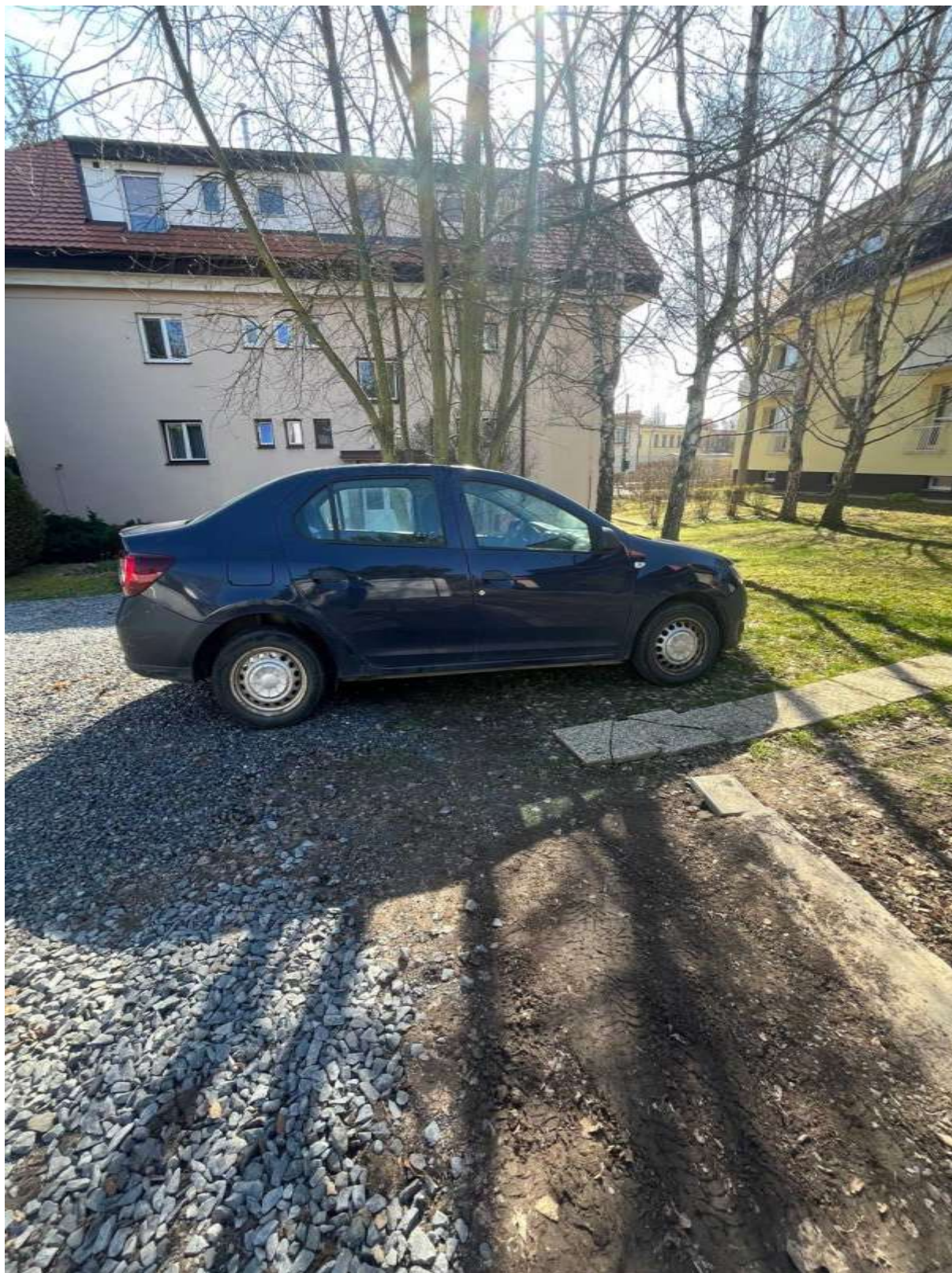
Obr. č. 55: parkování narušující zeleň