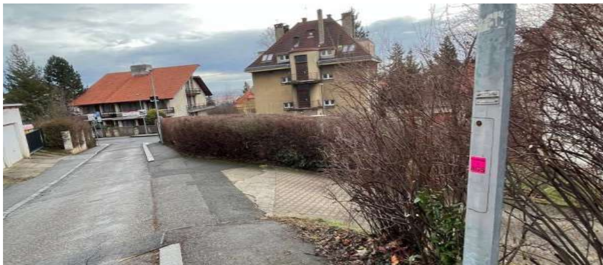
Obr. č. 67: Spodní příjezd do vnitrobloku v ul. Na Bartoňce