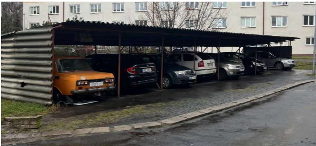
Obr. č. 32: vyhrazená parkovací stání s přístřeškem