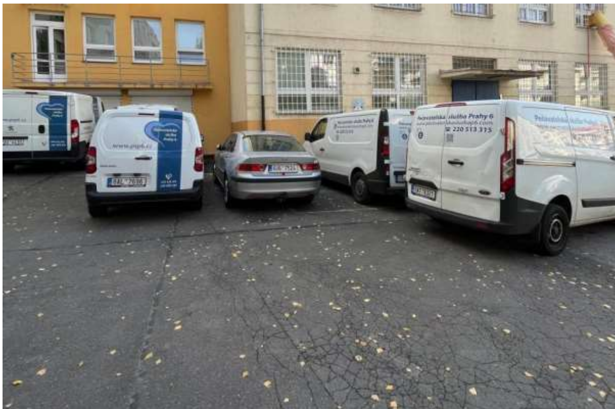
Obr. č. 22: Místo vyhrazeného parkovacího stání pro pečovatelskou službu Praha 6