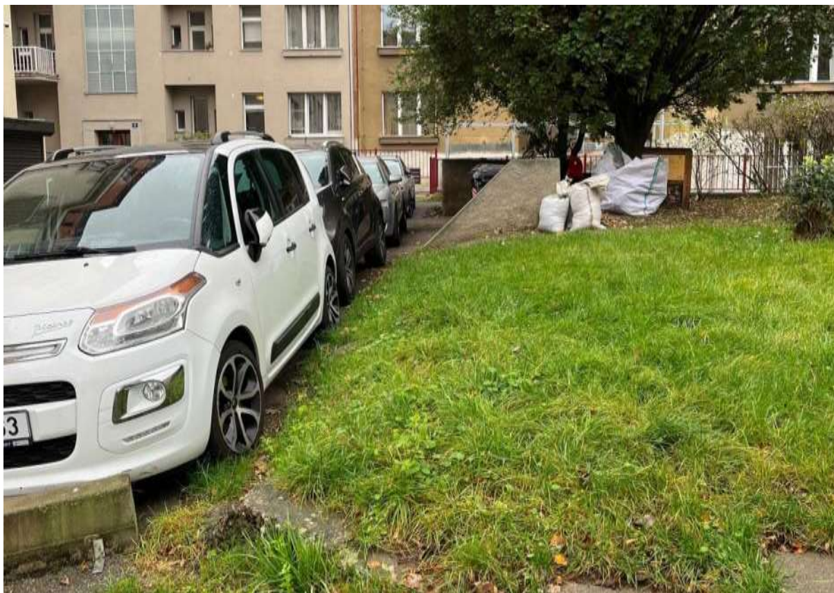
Obr. č. 11: Nevyhrazené podélné park. stání ve vnitrobloku Velflíkova ve vztahu k zatravněné ploše