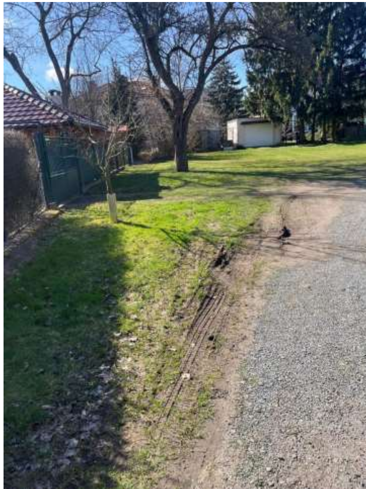
Obr. č. 41: zeleň poškozena provozem automobilů