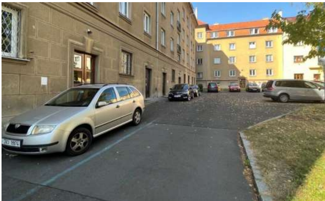
Obr. č. 14: Parkovací místa ve vnitrobloku Na Dlouhém lánu