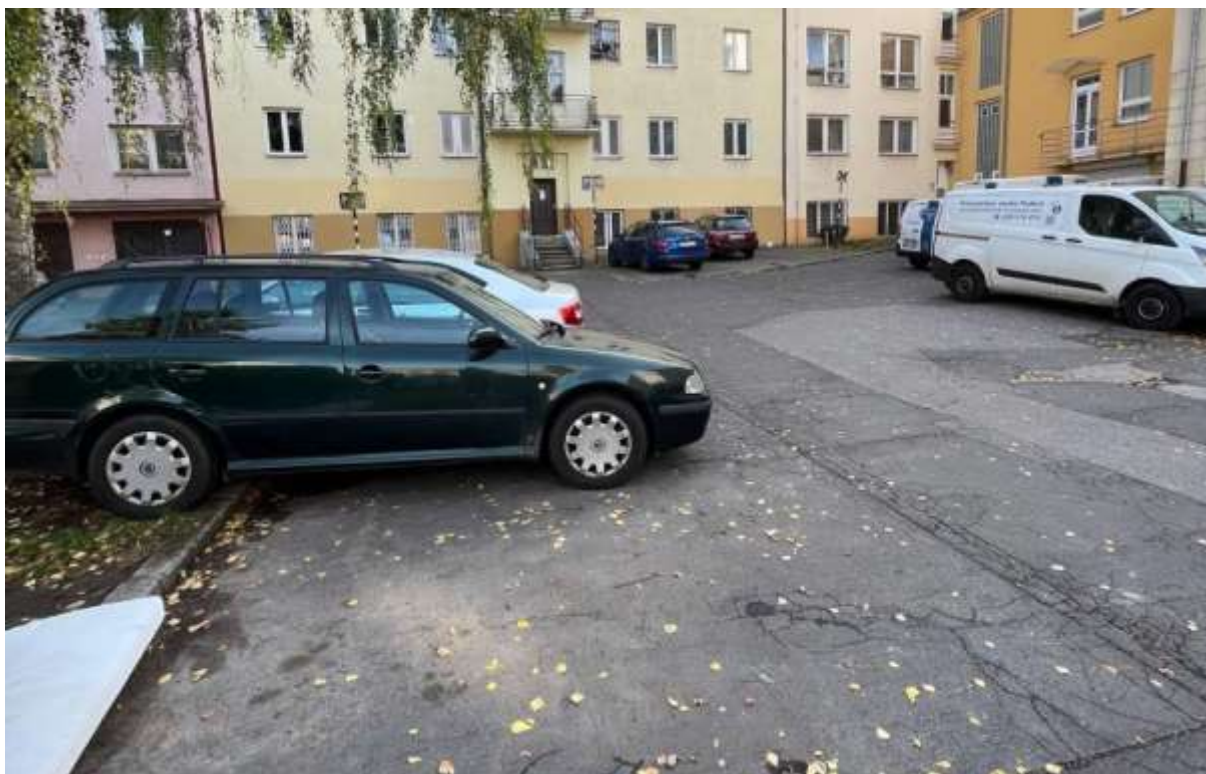
Obr. č. 20: Situace ve vnitrobloku Pod Marjánkou