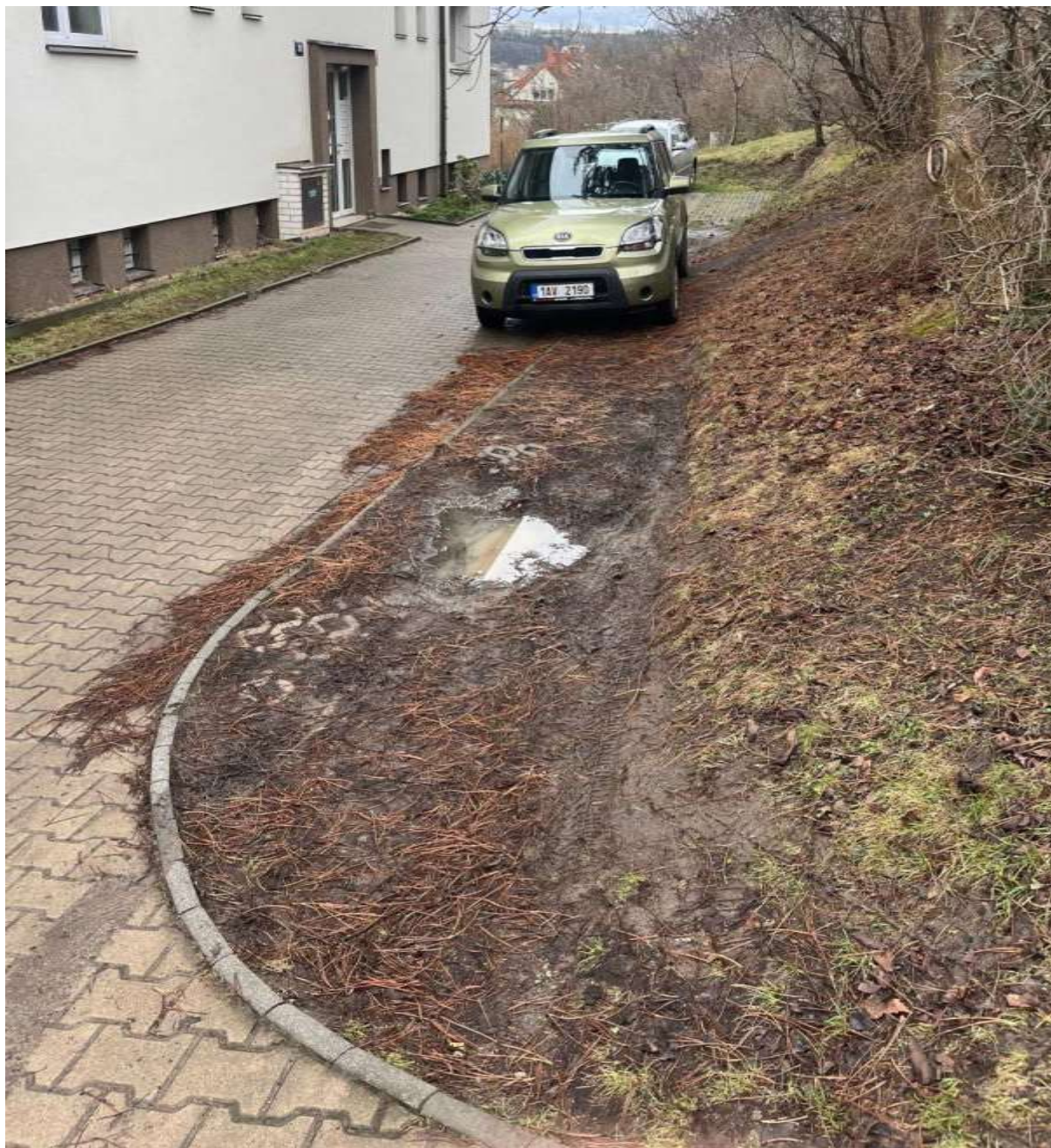
Obr. č. 66: stav „parkovací“ plochy vnitrobloku v ul. Na Bartoňce