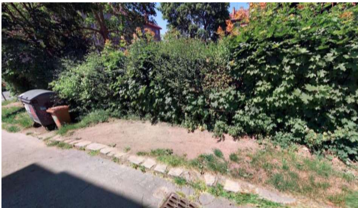
Obr. č. 30: místo, kde vlivem parkování ustoupil travnatý porost (fotografie z mapy.cz, období červen 2023, připojeno z důvodu lepší viditelnosti ústupu zeleně v období plné vegetace)