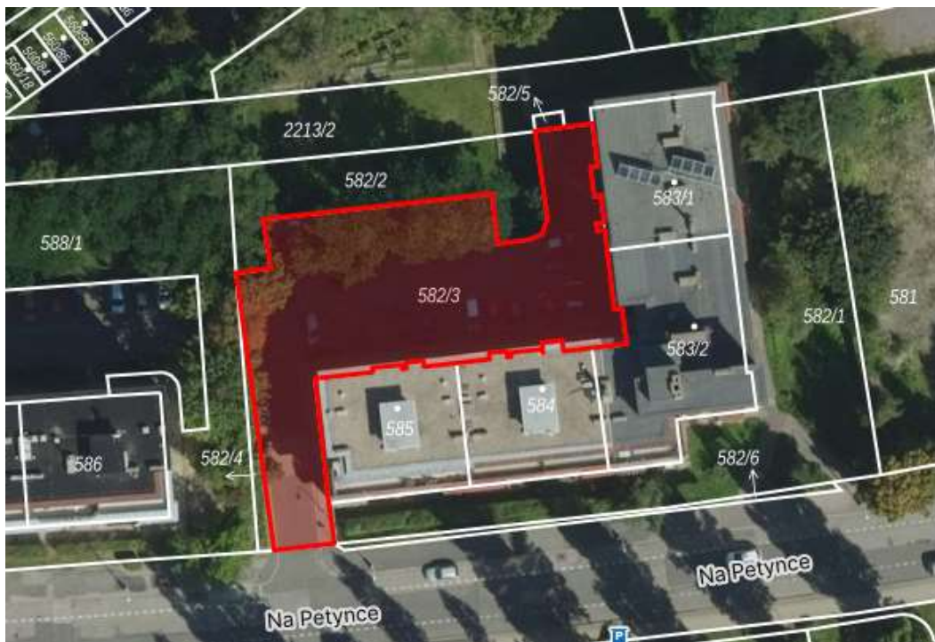
Obr. č. 84: vnitroblok č. 13 v ul. Na Petynce

Vnitroblok v ul. Na Petynce na parcele č. 582/3 , kat. území Střešovice je ve vlastnictví hl. m. Prahy se svěřenou správou městské části Praha 6.