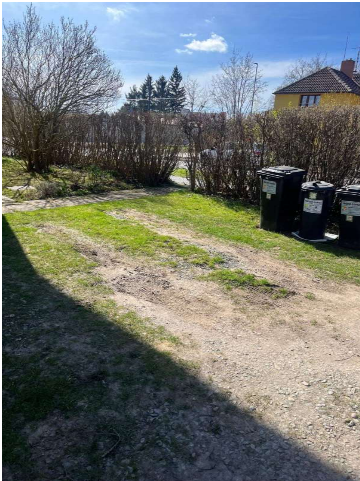
Obr. č. 74: travnatý porost narušený parkováním