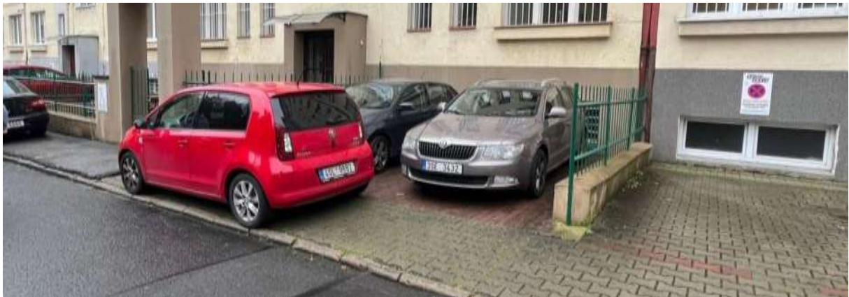
Obr. č. 5: Vyhrazená parkovací stání u budovy Velflíkova 1430/8 ve vnitrobloku