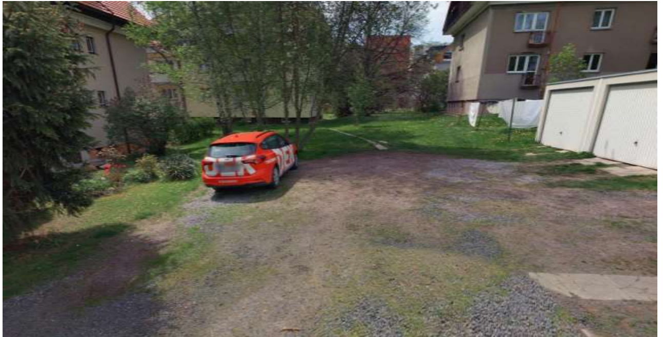
Obr. č. 49: místo, kde vlivem provozování automobilů ustoupil travnatý porost (období květen 2023, připojeno z důvodu lepší viditelnosti ústupu zeleně v období plné vegetace)