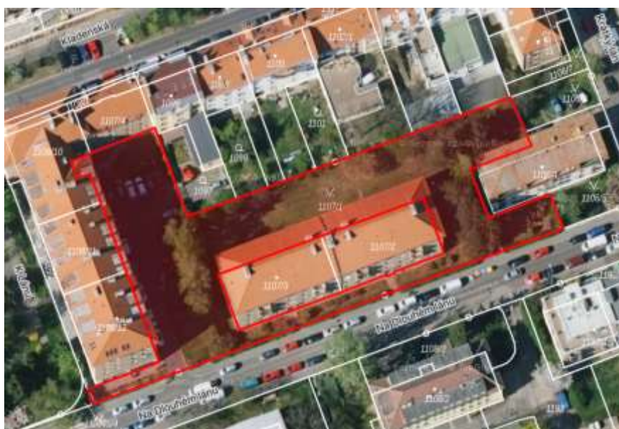
Obr. č. 12: Území vnitrobloku Na Dlouhém lánu, které je ve správě MČP6

Vnitroblok v ul. Na Dlouhém lánu na parcele č. 1107/1 , kat. území Vokovice je ve vlastnictví hl. m. Prahy se svěřenou správou městské části Praha 6.