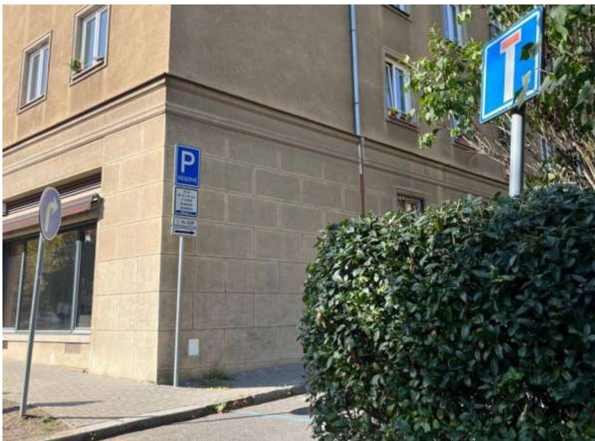
Obr. č. 13: Dopravní značení u vjezdu/výjezdu do vnitrobloku Na Dlouhém lánu

Parkování ve vnitrobloku je podélné a kolmé. Všechna parkovací místa spadají pod modrou parkovací zónu P6-0289. Jedno místo je vyhrazené pro oprávněnou osobu ZTP. Automobily parkují na zpevněné ploše a do zatravněné plochy nezasahují, ani jinak neohrožují další zeleň.