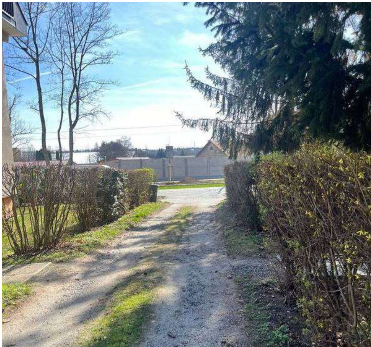
Obr. č. 51: příjezdová cesta k vnitrobloku Vlastina