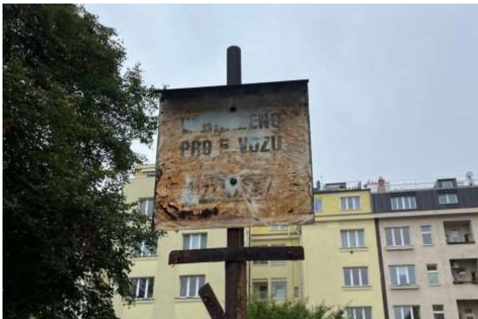
Obr. č. 10: Cedule vyhražující 5 podélných parkovacích stání pro VUSTE ENVIS, spol. s.r.o. ve vnitrobloku Velflíkova