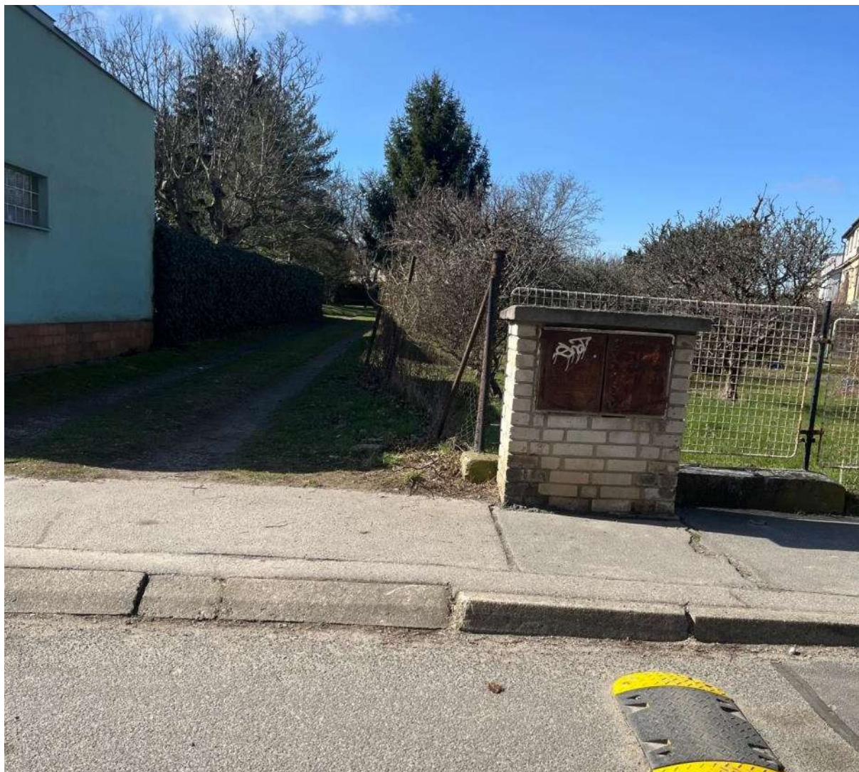
Obr. č. 44: Příjezd do vnitrobloku Radistů