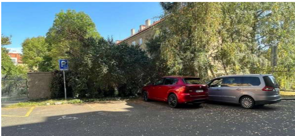
Obr. č. 15: Kolmá parkovací místa ve vnitrobloku Na Dlouhém lánu + vyhrazené parkovací místo