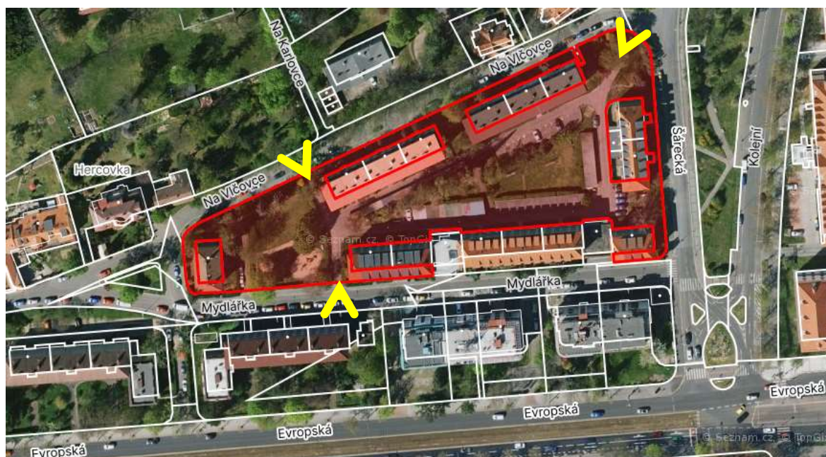
Obr. č. 28: Území vnitrobloku Šárecká (žlutými šipkami označeny vjezdy/výjezdy)

Vnitroblok v ul. Šárecká na parcele č. 3136/1 , kat. území Dejvice je ve vlastnictví hl. m. Prahy se svěřenou správou městské části Praha 6.