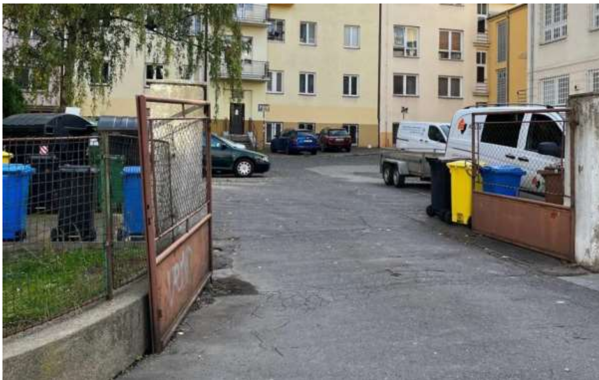
Obr. č. 19: Příjezdová branka do vnitrobloku Pod Marjánkou