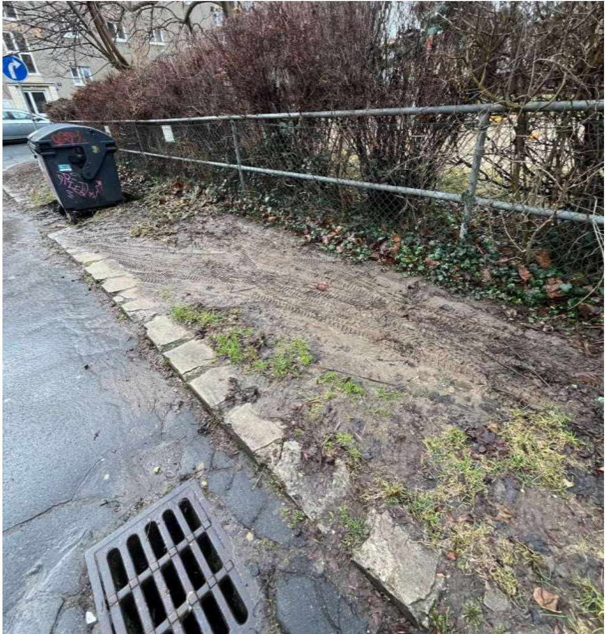
Obr. č. 34: stav travnatého pásu při výjezdu směrem do ulice Mydlářka, způsobeno neoprávněným, podélným parkováním na zeleni