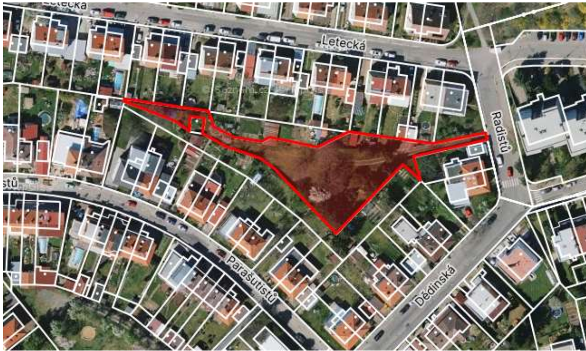
Obr. č. 43: Vnitroblok v ul. Radistů

Vnitroblok v ul. Radistů na parcele č. 1513 , kat. území Ruzyně je ve vlastnictví hl. m. Prahy se svěřenou správou městské části Praha 6.