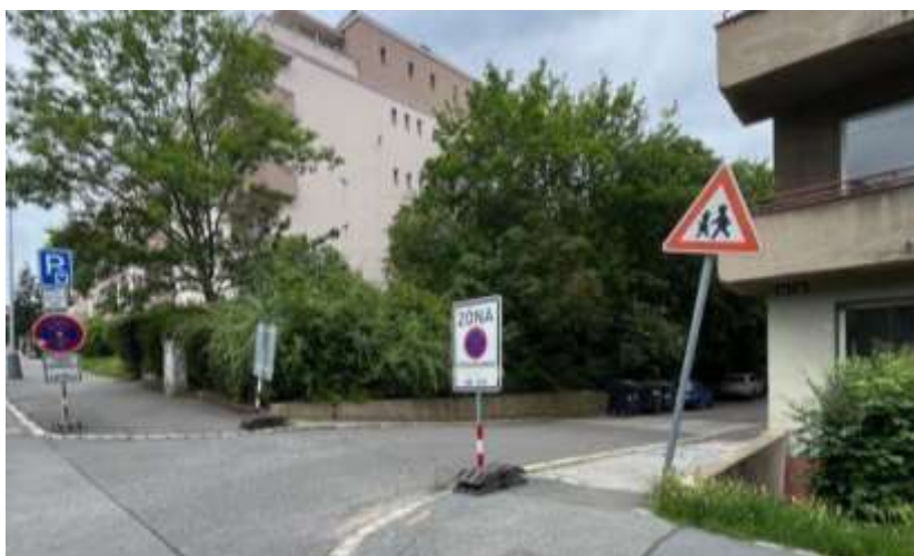
Obr. č. 85: vjezd do vnitrobloku č. 13 v ul. Na Petynce

Vnitroblok č. 13 v ulici Na Petynce je při vjezdu opatřen dopravní začkou A12b „děti“. Parkování je zřízeno na zpevněné ploše a je opatřeno rezidentním parkováním - modrou zónou P6-1659. V momentě, kdy probíhalo ohledání na místě bylo zjištěno, že osobní auta zde parkují i mimo oficiální parkovací stání, čímž dochází k narušování zeleně. Vymezené parkovací stání je místy rozrušováno kořenovým systémem přilehlých dřevin