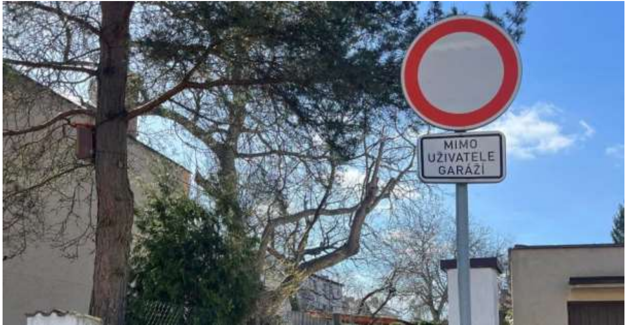
Obr. č. 38: dopravní značení u vjezdu do vnitrobloku