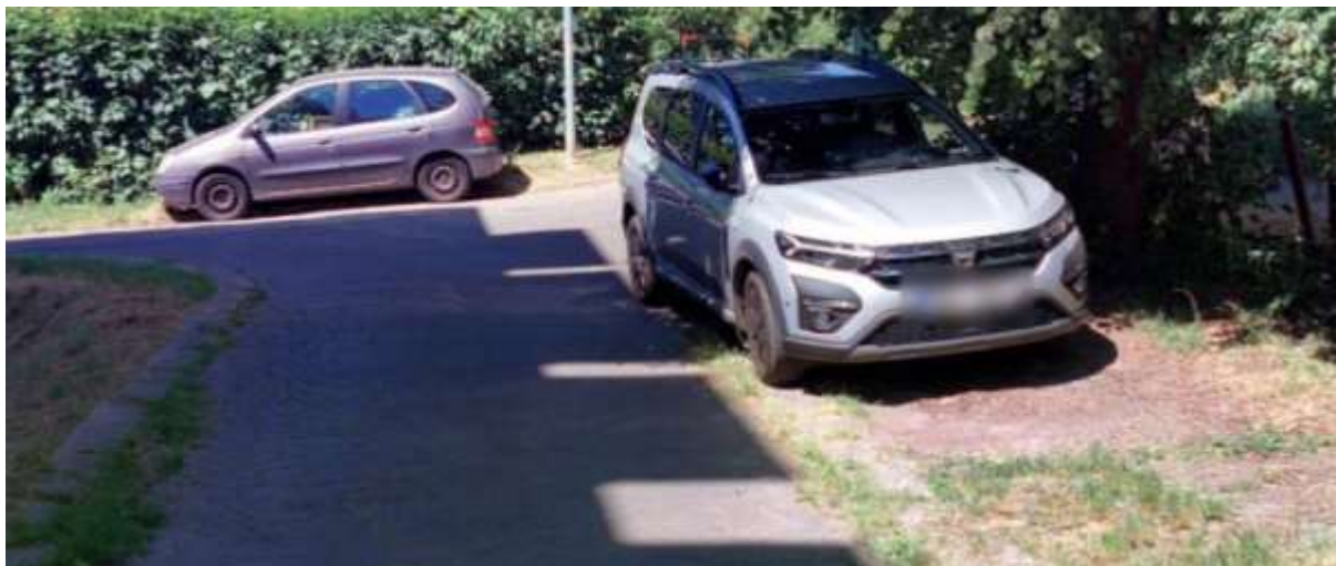
Obr. č. 29: parkování na zeleni (fotografie z mapy.cz, období červen 2023, připojeno z důvodu lepší viditelnosti ústupu zeleně pod auty v období plné vegetace)

Parkovací místa jsou zde vyhrazena pro privátní parkování (obyvatelům přilehlých domů). Parkovací místa jsou podélná i kolmá, z velké části zastřešena jednoduchým kovovým přístřeškem. V některých částech areálu jde vidět ústup zeleně, který byl způsoben parkováním automobilů mimo vyhrazená parkovací místa.