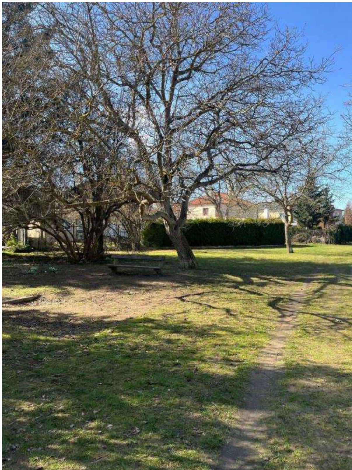
Obr. č. 47: Situace ve vnitrobloku Radistů