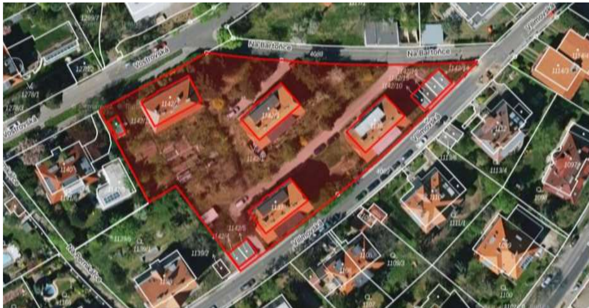
Obr. č. 64: Vnitroblok v ul. Na Bartoňce

Vnitroblok v ul. Na Bartoňce na parcele č. 1142/1 , kat. území Dejvice je ve vlastnictví hl. m. Prahy se svěřenou správou městské části Praha 6.